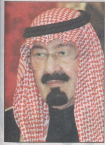
سمو ولي العهد ودعم مستر لرياضة الفروسية

المجمعة - عبدالعزيز الصالح، اعتمد صاحب السمو الملكي الأمير عبد الله بن عبدالعزيز ولي العهد نائب رئيس مجلس الوزراء رئيس الحرس الوطني ورئيس نادي الفروسية وفي مكرمة من مكارمه لشباب هذا الوطن صرف ميزانية سنوية لميادين الفروسية بالمملكة حيث استقبل الوسط الفروسي والرياضي هذه المكرمة وهذه اللفتة الكريمة بمزيد من الفعطة والسرور