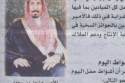
الأمير مشعل بن سعود

تحتفل فروسية نجران عصر اليوم (الخميس) بسباقها السابع للموسم الحالي على الدعم الخاص المقدم من صاحب السمو الأمير سلطان بن محمد بن سعود الكبير والذي تحققت لفروسية نجران بالمشاركة الحديثة والتوجهات الكريمة من لدن صاحب السمو الملكي أمير منطقة نجران حتى أصبح هذا الدعم سنوياً مما تحقق معه تطور وازدهار لهذه الرياضة الأصيلة. كما اشدت التناض الشريف بين الملك وتشطت حركة البيع والشراء بينهم وزاد عدد ملاك الخيل لتزاد معه الجيايد بمختلف درجاتها وعلى رأسها خيل الإنجاز المحلي. وأوضح المدير التنفيذي لفروسية نجران الأستاذ محمد بن مهدي فحاشم، أن سباق اليوم يتكون من ستة أشواط على جوائز الأمير سلطان بن محمد. وبهذه المناسبة عبر محمد فحاشم، باسمه ونياية عن ملاك الخيل بمنطقة نجران عن عيق شكره وامتنانه للأمير سلطان على هذا