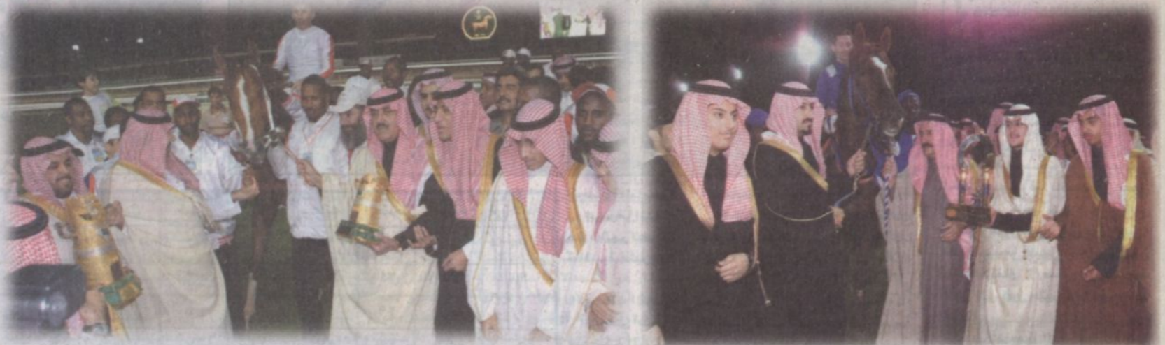
زعيم المهور (جايز) مع الأمير متعب بن عبدالله في احتفالية الفوز بكأس الملك عبدالعزيز