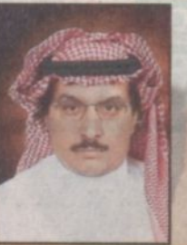
الأمير فهد بن عبد العزيز آل سعود