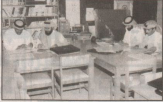
متابعة من العبادين للسجلات