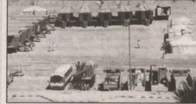
المستشفي الميداني في حوطة بني تميم