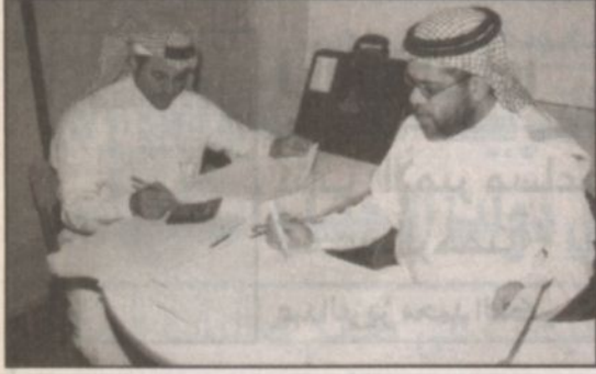
الرجل الحضان داخل غرفة السجلات

عمليات التجاوب للكوارت، وكوت مجموعة مختارة من المشاركين في هذه الحلقة، لدراسة أهم الكوارث التي تؤثر في منطقة غرب آسيا والتقنيات الفضائية التي يجب توفرها لصياغة توصيات واقتراحات حولها حتى يتم مناقشتها في مؤتمر ميونخ الذي يعقد في ١٨ أكتوبر الجاري، على أن تقدم إلى الجمعية العامة للأمم المتحدة لاحقاً.