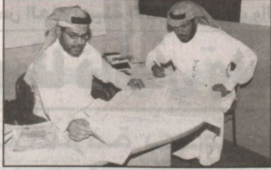
المراقب السلطان يتابع أحد السجلات