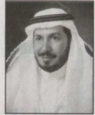
د. عبدالله الربيعه

سواء الرعاية الصحية الأولية أو المستشفيات العامة أو المراكز الطبية المتخصصة موضحاً في هذا الصدد بأن ذلك ضمن تقديم خدمات صحية جيدة للمواطنين وتقديم أفضل الخدمات للحوامل والأطفال سن الدراسة والتدريب المستمر للعاملين في مجال الرعاية الصحية الأولية. وشدد مدير صحة الحرس الوطني في ختام تصريحه على أهمية إيجاد قنوات في الاستفادة القصوى من الدعم المتاح وتعاون القطاعات الصحية في معالجة الترابطات والتخطيط الصحي السليم والذي يخدم تطور الخدمات الصحية بين القطاعات المختلفة في الوطن.