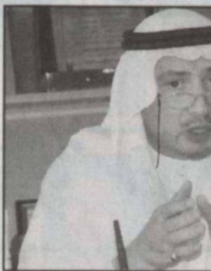
عون الله عون الله