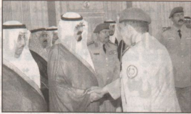
ولي العهد مستقبلاً قادة الحرس الملكي