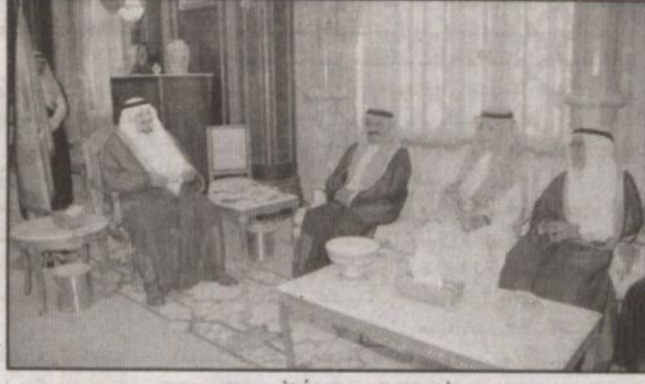
الأمير سلطان مستقبلاً الأمراء والوزراء