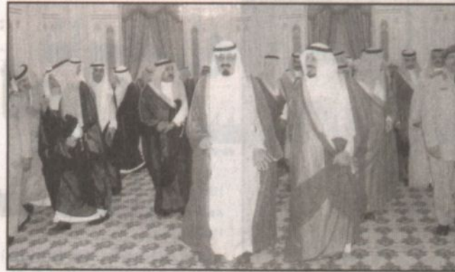
الأمير عبدالله والأمير سلطان خلال الاستقبال

فخامة الرئيس اسلام كريموف - رئيس جمهورية أوزبكستان، فخامة الرئيس صفر مراد نيازوف - رئيس جمهورية تركمانستان، فخامة الرئيس ياسر عرفات - رئيس دولة فلسطين، صاحب السمو الشيخ حمد بن خليفة آل ثاني - أمير دولة قطر، فخامة الرئيس العقيد عثمان غزالي - رئيس جمهورية القمر المتحدة، صاحب السمو الشيخ جابر الاحمد الصباح - أمير دولة الكويت، فخامة الرئيس مأمون عبد القيوم - رئيس جمهورية المالديف. وقد أجابهم حفظه الله معرباً لهم عن أطيب تهانئه وأخلص تمنياته بأن يديم الله عليهم نعمة الصحة والعافية وأن ينعم على شعوبهم وعلى جميع شعوب الأمة الإسلامية بمزيد من التقدم والازدهار.