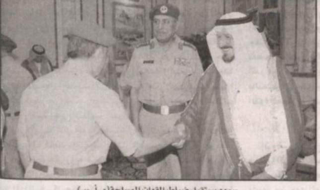
سموه يستقبل ضباط القوات المسلحة

السمو الأمراء والمعالي الوزراء والفضيلة المشايخ الذين قدموا لسلام على سموه وتهنئته بمناسبة شهر رمضان المبارك. كما استقبل سموه النائب الثاني لرئيس مجلس الوزراء وزير الدفاع والطيران والمفتش العام الأمير الدكتور عبدالعزيز بن سعود الكبير وكيل وزارة الخارجية المساعد للشؤون السياسية وصاحب السمو الملكي الأمير الدكتور عبدالعزيز بن ناصر بن عبدالعزيز وصاحب السمو الملكي الأمير سلطان بن سلمان بن عبدالعزيز الأمين العام للهيئة العليا للسياحة وصاحب