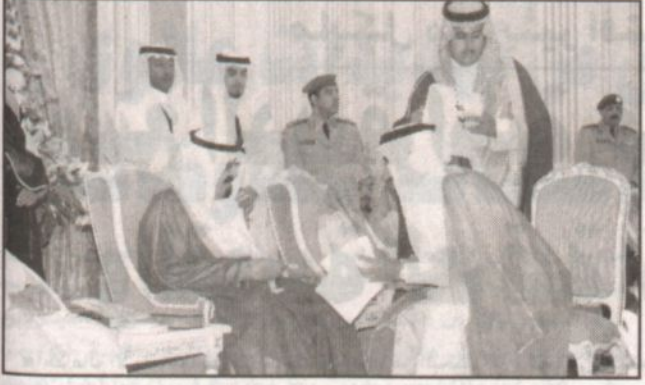
سموه يستقبل المواطنين