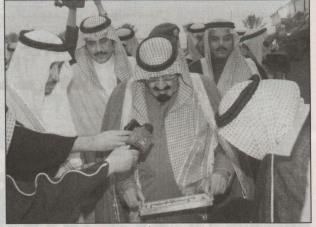
ولي العهد يضع حجر الأساس للجبيل ٢