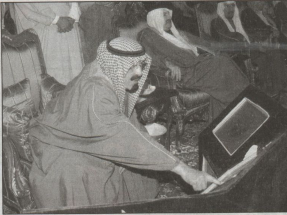
سمو يدشن أحد المشروعات في الجبيل

شيء من العقل.. شيء من الذوق لأن العلاقات السعودية المحترمة دولياً هي التي أنقذت العقيد من المحاصرة ووصلت بمأساة لوكربي إلى حل.. لكنها بأي حال لم تدفع به إلى هذا الوضع الساخر المضحك واليائس في بلد بترولي حيناً لو أن صحافة ليبيا قالت لنا بالأرقام عن منجزاته..!