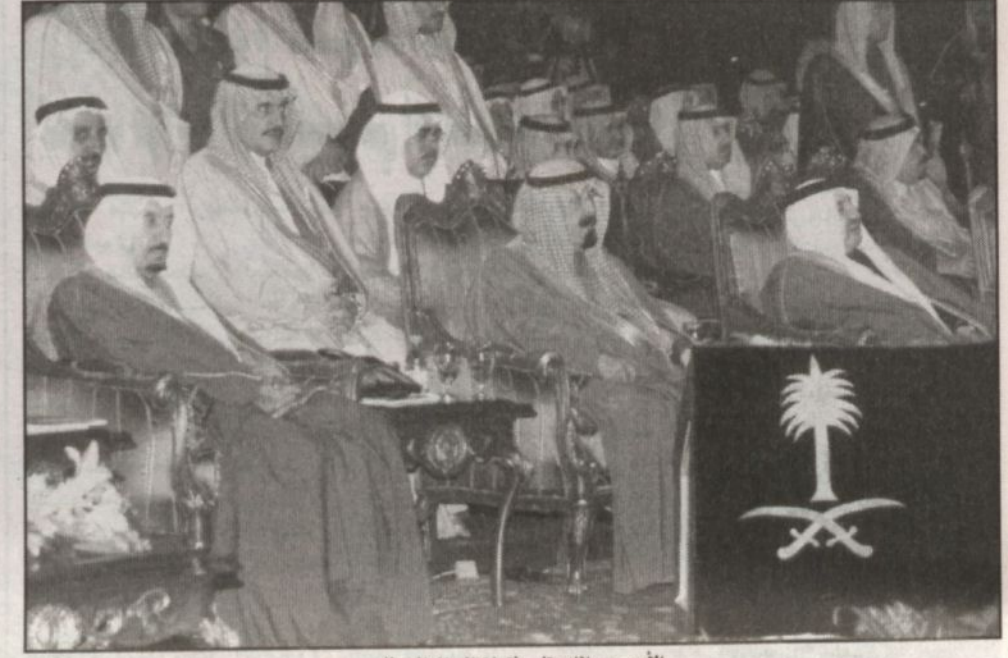
الأمير عبدالله يتابع فقرات الحفل الخطابي

الملك لليبيل وينبع عن بعض النجاحات الكبيرة التي تحققتها الشركات الوطنية العملاقة التي تستثمر في المدينتين الصناعيتين وفي مقدمتها الشركة السعودية للصناعات الأساسية «سابك» وشركة المصنعة أرامكو السعودية وشركة مصفاة أرامكو السعودية والشركة العربية السعودية لزيتو التشحيم وشركة التصنيع الوطنية للبتروكيماويات والشركة