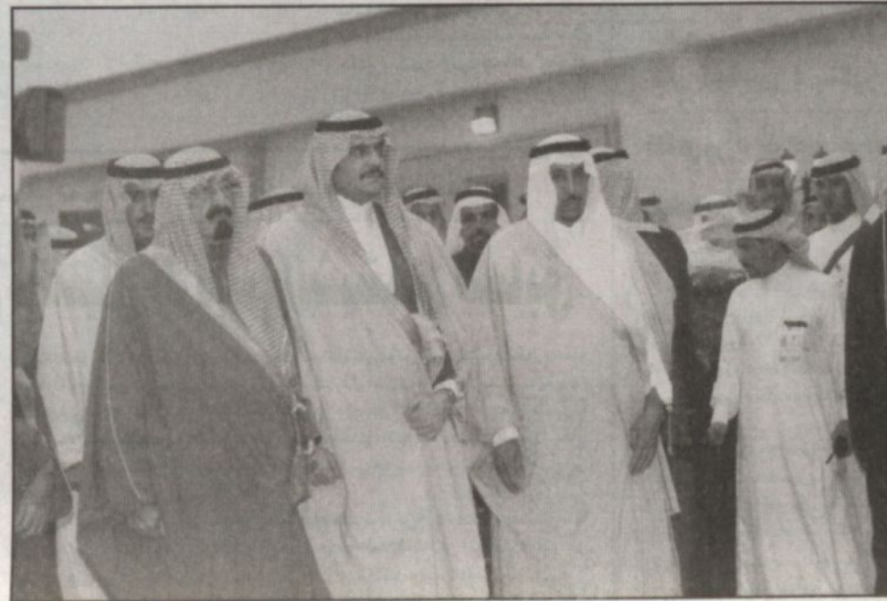
ولي العهد لدى وصوله مقر الحفل