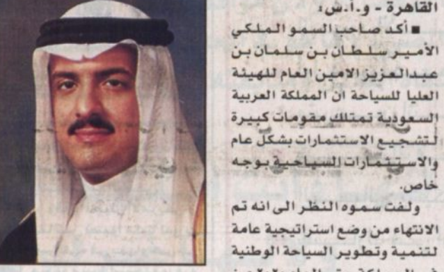
الأمير سلطان بن سلمان

القاهرة - و.أ.س: أكد صاحب السمو الملكي الأمير سلطان بن سلمان بن عبدالعزيز الأمين العام للهيئة العليا للسياحة ان المملكة العربية السعودية تمتلك مقومات كبيرة لتشجيع الاستثمارات بشكل عام والاستثمارات السياحية بوجه خاص. ولفت سموه النظر الى انه تم الانتهاء من وضع استراتيجية عامة للتنمية وتطوير السياحة الوطنية في المملكة حتى العام ٢٠٢٠م خلال خطط خمسية.