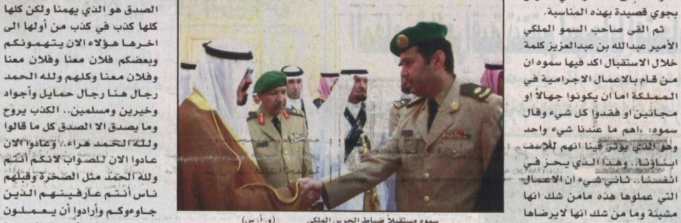
سمو مستقبلاً ضباط الحرس الملكي (و.أ.س)

الاسلام على كل شيء والاسلام ما شي.. الاسلام ما شي في أفريقيا ماشي في أوروبا في آسيا في أمريكا ماشي ما شي بإرادة الله والحمد لله الحمد لله.. وأنتم هنا يا اخوان لا ضحيفهم ولا الحمد مسلمين ومسلمين وأجواد ولا تضمرسون لاحد شر ومن يضمر لكم الشتر ان شاء الله سيق في شر أعماله وشكرا لكم. حضر الاستقبال صاحب