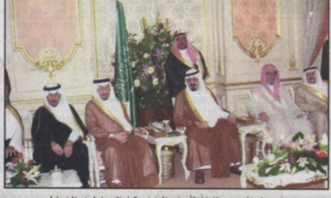
الأمير عبدالله خلال الاستقبال