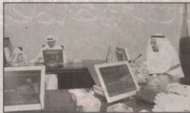
مبنى مترسلاً الاجتماع (واس)

الختامي للعام المالي ٢٠٠٤، والميزانية التقديرية للعام ٢٠٠٥ وموضوع تأييد الوحدات السكنية لمشروع المؤسسة بالإضافة الى مناقشة ما استجد من اعمال.