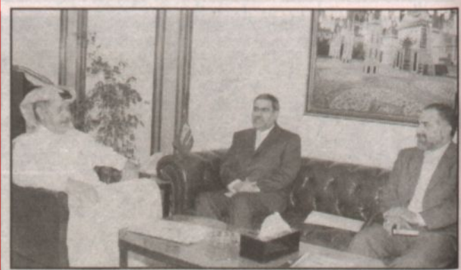
الفرسي خلال الاستقبال