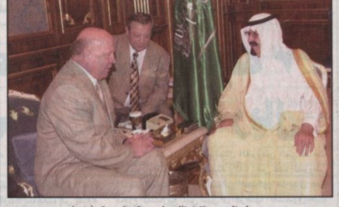
سمو ولي العهد يستقبل نائب رئيس حكومة موسكو