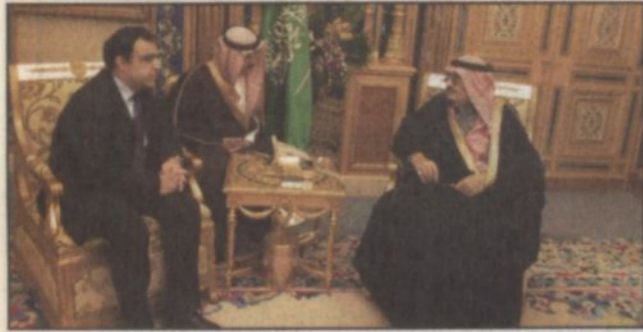
ويستقبل سفير اليونان

تحياته وتقديره لفخامته. حضر الاستقبال صاحب السمو الملكي الأمير عبدالعزيز بن فهد بن عبدالعزيز وزير الدولة عضو مجلس الوزراء رئيس ديوان رئاسة مجلس الوزراء ومعالى رئيس الديوان الملكي الأستاذ محمد التويصر ومعالى المستشار الخاص لخادم الحرمين الشريفين الأستاذ إبراهيم العنقري ومعالى وزير الدولة