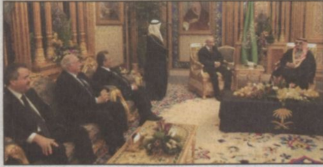
خادم الحرمين يستقبل رئيس وزراء لبنان

الدكتور الياس سابا ومعالى وزير الأشغال العامة والنقل ياسين جابر ومعالى وزير الطاقة والمياه مويريس صحنائي والقائم بالأعمال اللبناني في المملكة علي غزوي. كما استقبل خادم الحرمين الشريفين حفظه الله في مكتبه بقصر اليمامة أمس سفير اليونان لدى المملكة جورج بابا ديونولس. وقد نقل السفير اليوناني لخادم الحرمين الشريفين تحيات وتقدير فخامة الرئيس سستيلينيوس ستيانوبولس رئيس الجمهورية اليونانية فيما حمله زعاه الله