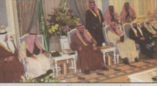
الأمير عبدالله خلال استقباله الأمراء وكبار المسؤولين

بالديوان الملكي بقصر اليمامة أمس معالي الأمين العام لمجلس التعاون لدول الخليج العربية الأستاذ عبدالرحمن بن حمد العتيبة. حضر الاستقبال صاحب السمو الأمير الدكتور بندر بن سلمان بن محمد آل سعود المستشار في ديوان سمو ولي العهد ومعالى المستشار في ديوان سمو ولي العهد التوجيهي ومعالى المستشار في ديوان سمو ولي العهد المنسوب المغفوض على الشؤون الصحية بالحرس الوطني الدكتور فهد العبدالجبار.