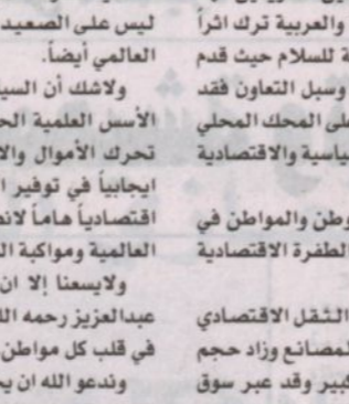
سعد إبراهيم المعجل

رحم الله خادم الحرمين الشريفين الملك فهد بن عبد العزيز آل سعود وأسكنه فسيح جناته كان رحمه الله مهتماً اهتماماً واسعاً ببناء الإنسان السعودي من خلال تعليمه وتدريبه ومهتماً ببناء الوطن. خاصة البنية التحتية. سأختصر حديثي في هذه المجالة على التنمية الصناعية في قترتي الملك فهد خلال توليه ولاية العهد في عهد المرحوم الملك خالد وخلال فترة توليه الملك وفي خلال هاتين القترتين كان يرحمه الله المسؤول الأول عن ملف التنمية الاقتصادية. وترأس يرحمه الله أول مجلس لهيئة الملكية للجبيل وينبع وشهدت مدنيتي الجبيل وينبع تجهيزاً هائلاً لتكونا مركزين مهمين للصناعات البتروكيمياوية وكان رحمه الله رئيس مجلس البترول الأعلى وقد اتخذ المجلس أحد أهم القرارات الصناعية وهو تجميع الغاز