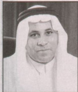
فهد بن عبد العزيز آل سعود

العربية السعودية وفقهها الله وسدد خطاهما.