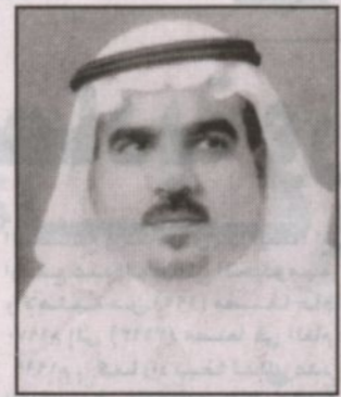
عبدالله صالح العثيم

الحرمين الشريفين عبدالله بن عبد العزيز ملكاً للمملكة العربية السعودية واختيار الملك عبدالله لصاحب السمو الملكي الأمير سلطان ولياً للعهد ومما يشجع صدورنا ويخفف مصائبنا جميعاً هذا التلاحم بين الأسرة المالكة والشعب السعودي والأمة العربية والإسلامية وما نسعته ونقرأه لجزء يسير من إنجازات وخصال وحكمة وبعد نظر لهذا القائد العظيم الذي لا يمكن لقلم أن يسيطر خصاله والحقيقة اليوم بحق للأسرة المالكة والشعب السعودي والأمة العربية والإسلامية أن تفخر بأن من أنبأها ما يوصف بهذا الوصف رغم أن جميع ما ذكر وسوف يذكر لن يفي هذا الزعيم حقه ولكن له منا الدعاء بالمغفرة والرحمة ولملكنا العزيز عبدالله بن عبد العزيز خير خلف لخير سلف الدعاء بالتوفيق والسداد وللمساعده الأيمن وولي عهده الأمين أميرنا المحبوب سلطان بن عبد العزيز العون والتوفيق.