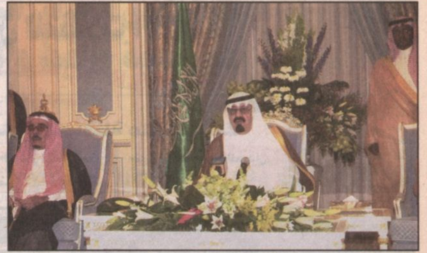
سمو ولي العهد يستقبل الأمراء والوزراء وكبار المسؤولين وجمعا من المواطنين

خاطب وفد قبيلة الفهيات: أبأؤكم وأجدادكم ما سمعنا عنهم إلا كل خير وأنتم تتبعونهم