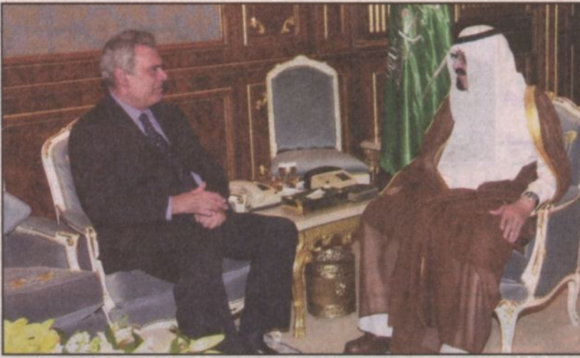
سمو ولي العهد يستقبل عضو البرلمان اللبناني