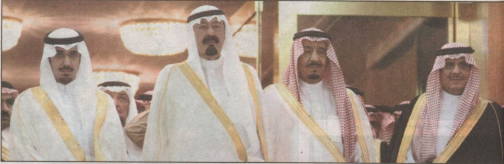
ولي العهد أثناء رعايته للتهنئة ويظهر في الصورة الأمير سلمان بن عبدالعزيز والرئيس العام ونائبه

السن وشكر كل أعضاء الشرف الذين ساهموا بالانجاز الهلالي سواء بالدمع او غيره وقال هناك أعضاء شرف دعموا النادي قبل المباراة النهائية او الموسم الحالي ولكن لا يرغبون ذكر اسماءهم فهؤلاء لهم الشكر كما اننا لانسى الاعضاء الداعمين مثل الأمير الوليد بن طلال والاستاذ صالح الصقري، وكل عضو شرف هلالى يقف خلف انتصار يتحقق للهلال. الجدير بالذكر ان هناك توجه لدى الهلاليين للقيام ببعض الزيارات لتشخصيات هلالية ستحدد مستقبلاً. من جانب آخر حضرت جماهير هلالية غفيرة البارحة لتسمر الثاني لتبادل التهنئة بالفوز بالكأس والالتقاء باللاعبين الا ان (اجازة) الامس منعتهم من تهنئة اللاعبين. وشهد مقر النادي احتفالية داخله من خلال أسابيع العرض التي وضعت بممرات النادي وتم