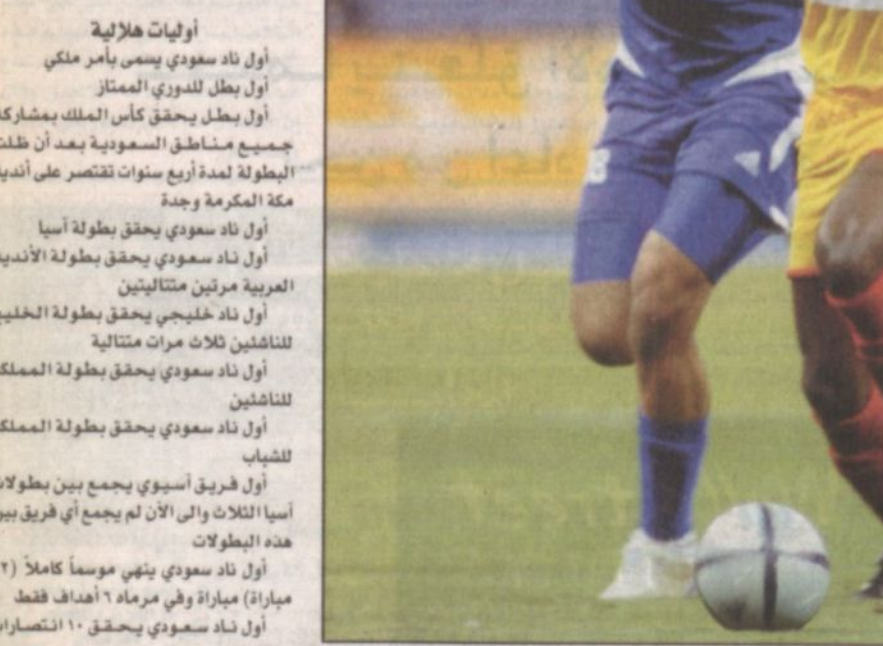
الاعتبار قاد الهلال للإنجاز الجديد

واحرز الهلال اللقب الخامس له في هذه البطولة التي حقق لقبها ٤ مرات أعوام ١٩٦٤ و١٩٦٥ و٢٠٠٠ و٢٠٠٢ وحسر نهائي عام ١٩٩٩ أمام الشباب. وكان الهلال استهل مشواره في البطولة بتخطي الرائد في دور ال١٦ ثم أراح الوحدة من ربع النهائي وفي نصف النهائي أطاح بالاتحاد (حامل اللقب) بعد ان هزمه ذهاباً بالرياض ١-٠ صفر ثم تعادلاً ١-١ اياباً في جدد. وأضاف الهلال بطولة جديدة إلى خزائنه المتخمة بالكؤوس والبطولات وواصل مسيرته الناجحة هذا الموسم التي بدأها بإحراز كأس الأمير فيصل بن فهد (أولى البطولات المحلية) وتأهل إلى المربع الذهبي بالدوري ويطلق في التأهل لنهائي دوري أبطال العرب بالرغم من خسارته أمام الاتحاد صفر-١ على أرضه في الرياض في الدور نصف النهائي بعد أن شارك بتشكيلة أغلبها من الصف الثاني لرفيقته في إراحة لاعبيه الأساسيين للقاء نهائي كأس ولي العهد. وعضو الهلال عام الجفاف، الموسم الماضي الذي خرج منه خالي الوفاض بعد ان أحرز الشباب السوري والاتحاد كأس ولي العهد والاتفاق كأس الأمير فيصل بن فهد.