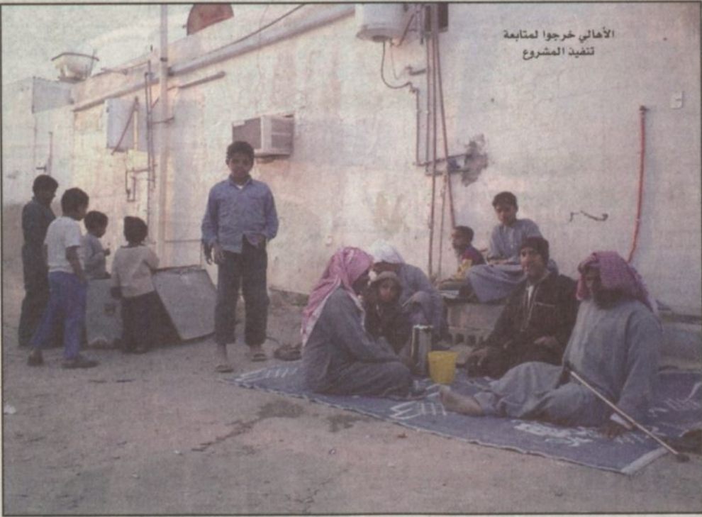
الأهالي خرجوا لمتابعة تنفيذ المشروع

ماسة جداً إلى مسكن ملائم كما تم ترشيحها أيضاً من قبل فريق البحث الاستطلاعي الخاص للمنطقة الشرقية لعدد من الاعتبارات منها ارتفاع نسبة الأسر المحتاجة إلى الإسكان حيث يقدر عددهم بنحو ٥٦٧ أسرة وسهولة الوصول إليها من خلال الطرقة المعبدة كارتباطها بطريق قطر