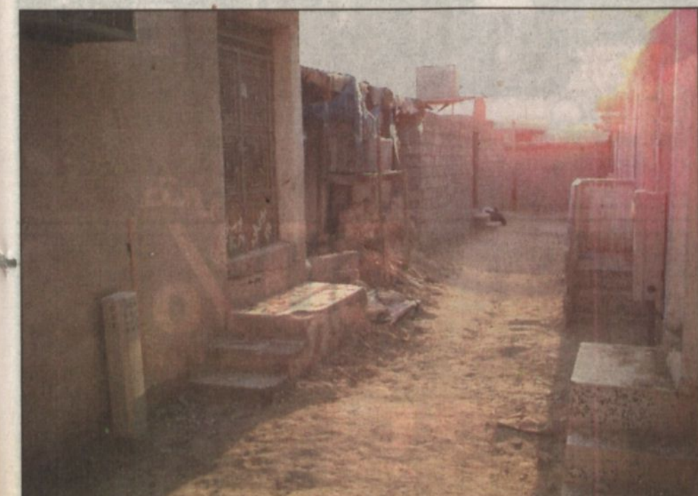
المشروع الجديد سينقل المواطنين للعيش في مساكن جديدة