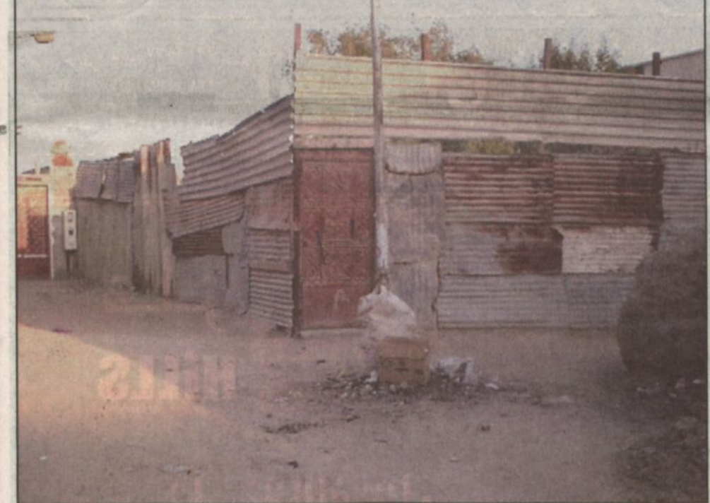
أحد مساكن المواطنين في قرية الجرن

س.ب ١٢٢٤٤، الرياض ١١٤٦٤، المملكة العربية السعودية تلفون ١٧٧٩٣٠٠ (١) ٩٦٦ + فاكس ١٧٧٩٠٠٨ (١) ٩٦٦ + Marriott.com/RUHSA riyadh@marriott.com