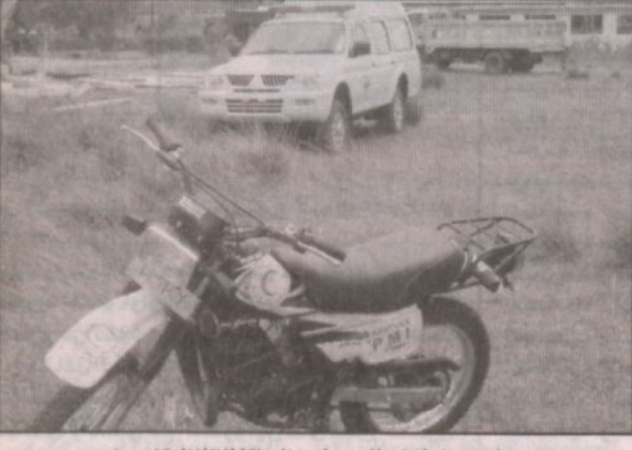
سيارات ودراجات إسعاف هدية من المملكة لإنقاذ المتضررين

متابعة - نايف آل زاحم قامت المملكة بتأمين ٥٠٠٠ سلة غذائية للمشردين بالبراء في جزيرة نياس بأندونيسيا بعد وقوع الزلزال وتحتوي هذه السلة على المواد الغذائية الأساسية كما قام الفريق الإغاثي بجمعية الهلال الأحمر السعودي بنقلها وتوزيعها وشحن تلك المساعدات جوا بالتنسيق مع الاتحاد الدولي وقد بلغت قيمة هذه المساعدات ٥٤,٢٠٠ دولار أمريكي. وتم شراء ثلاث سيارات إسعاف دفع رياضي ليتمكن استخدامها في مثل هذه الظروف الصعبة في جزيرة نياس وهذه دفعة أولى من سيارات الإسعاف المتبرع بها من أصل عشرين سيارة من قبل المملكة بشكل عاجل وتسليمها إلى الصليب الأحمر الأندونيسي تحمل اسم وشعار جمعية الهلال الأحمر السعودي