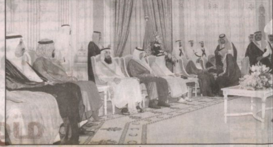
سمو ولي العهد يستقبل الأمراء والوزراء والمواطنين