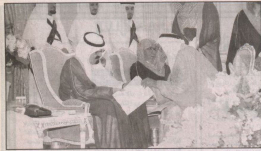
الأمير عبدالله خلال استقباله المواطنين