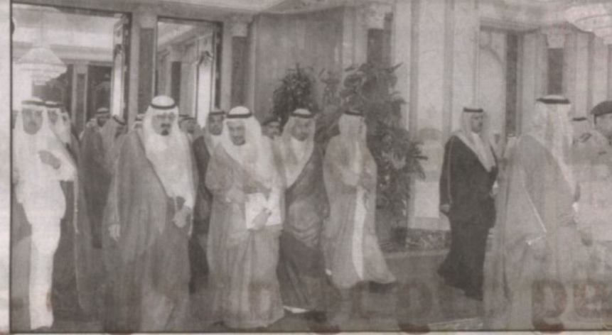
الأمير عبدالله خلال الاستقبال