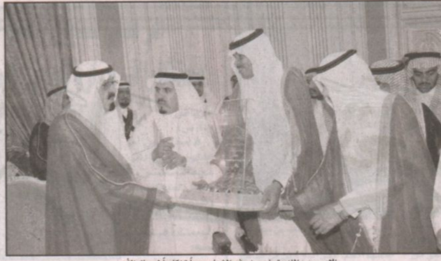
الأمير عبدالله يتسلم من وفد الشباب درعاً تذكاريًا لرجال الأمن