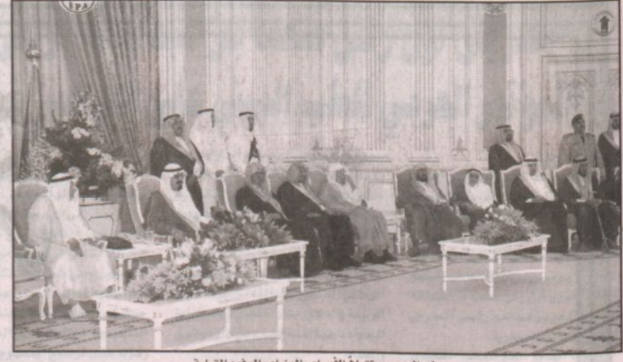
ولي العهد مستقبلاً الأمراء والوزراء والوفود القبلية

الله.. أبدا أبدا.. لا أمانونا ولا سلفونا ولا أخذنا منهم ريبا ولا واحدا وأنتم تكلم فضل على أغلب الدول وهذا من فضل الله عليكم.. أشكروا ربكم فوالله شكرتم لأزيدنكم، والشكر يحفظ النعم وأنتم ولله الحمد بخير.. وأدعو الله أن يوفقكم للحظ الطيب لخدمة هذا الدين وهذا الوطن.. وأكرهها دين ووطن وصبر وعمل هذه الأربع لا بد أن تضوها أمام عيونكم وتنتبهون لها لأنه لن يخدم وطنكم إلا الله ثم أنتم وأنتم إن شاء الله فيكم البركة.. وأتمنى لكم التوفيق والصحة..