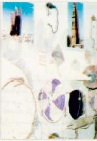
من جناح الجوف

تشارك المؤسسة العامة للتأمينات الاجتماعية للمرة الخامسة ضمن فعاليات المهرجان الوطني الثامن عشر للتراث والثقافة وتأتي هذه المشاركة في ظل التوجهات الكريمة والاهتمام الذي يحظى به المهرجان من خادم الحرمين الشريفين الملك فهد بن عبدالعزيز وسموه ولي عهد الأمين «حفظهما الله» الذي أصبح حدثاً مميزاً يعنى بالتراث الاصيل للمملكة والإسهام بالثقافة والتسليط الضوء على إنجازات وعطاءات العديد من مختلف القطاعات والمؤسسات الحكومية والخاصة والجانب التاريخية لهذا الوطن الخالي. وتقوم مشاركة المؤسسة في فعاليات المهرجان من خلال التعريف بنظام التأمينات الاجتماعية ولوائحه التنفيذية، وما يقدمه من خدمات ومزايا للمؤمنين فيه وكذلك للرد على أسئلة وأسئلة سارات مزورة والمؤمنين الذين يرغبون معرفة دور التأمينات الاجتماعية وأنظمتها وما تقدمه للشرائح الكبيرة بالتنسبية إليها، وتوزيع مطبوعات المؤسسة ومجلة التأمينات والمطويات والنشرات التعريفية بالنظام وأهدافه. ويشمل جناح المؤسسة عرضاً لإنجازاتها المختلفة في مجال الاستثمار العقاري والاستثماري، ويقوم كل من مستشفى التأمينات والمستشفى الوطني بتقديم والخدمات الطبية المجانية والحالات الإسعافية العاجلة والنزاه من خلال مشاركتها في الجناح.