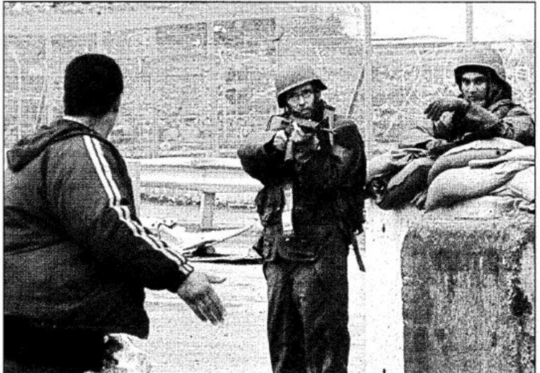
○ كلانديا - الضفة الغربية: جندي إسرائيلي يصبو بندقيته على رجل فلسطيني عند نقطة تفتيش مخيم كلانديا للاجئين.

تتوالى الامم المتحدة بالتعاون مع راعي المسيرة السلمية والاتحاد الأوروبي. وأضاف قائلا «ان الانسحاب الإسرائيلي أصبح امرا حتميا خطوة سابقة لحل سياسي فكفي ما اضيانه من سنوات المفاوضات التي زادت عن عشر سنوات عدنا بعدها الى نقطة الصفر بسبب الاعتداءات الإسرائيلية وحماصا وراهبا».