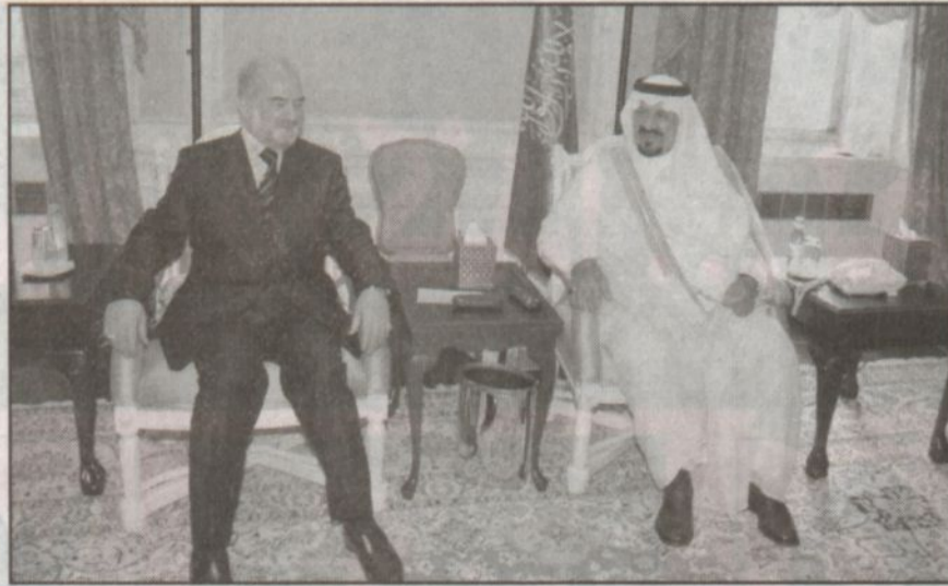
سمو ولي العهد يستقبل الجعفري (و.أ.س)