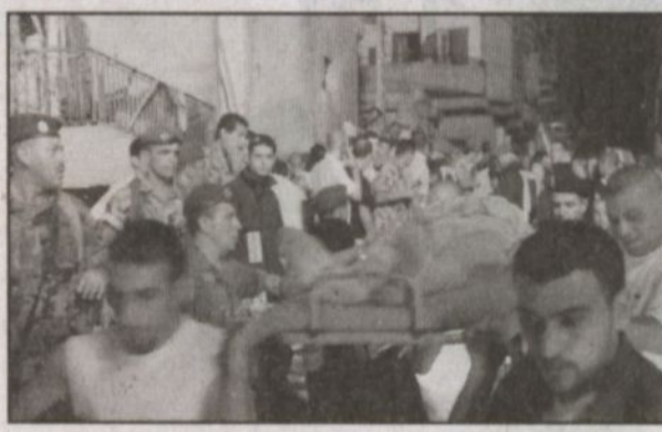
أحد الجرحى ينقل إلى المستشفى