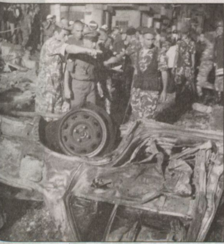
إحدى السيارات التي دمرت نتيجة للانفجار