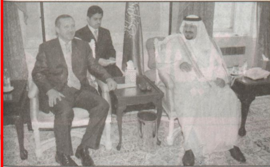
سمو ولي العهد يستقبل رئيس الوزراء التركي