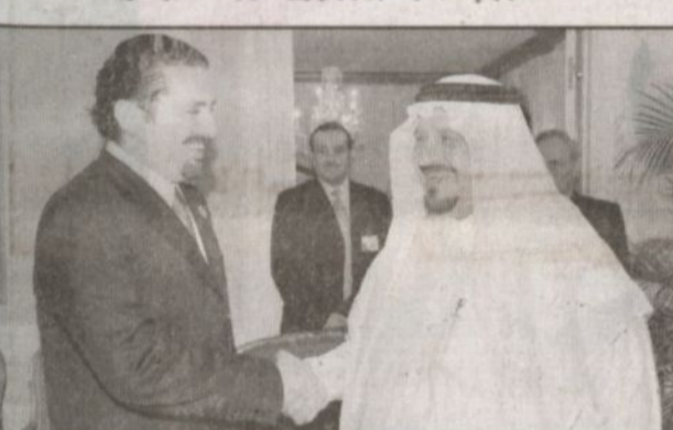
ولي العهد يلتقي سعد الحريري في مقر الأمم المتحدة بنيويورك