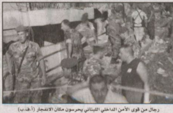
رجال من قوى الأمن الداخلي اللبناني يحرسون مكان الانفجار