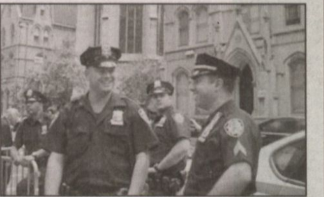
مجموعة من رجال الأمن يتجادون الحديث خلال عملية الحراسة في شوارع نيويورك

لذلك لا شك بأن سكان مدينة نيويورك يشعرون بالراحة من انتهاء القمة ومغادرة الضيوف. إلا أن أحد سكان نيويورك ذكر لي بأن مدينة نيويورك وخاصة مناهن دائماً بشديدة الزحمة سواء بوجود القمة أو بدونها. فهي مدينة صغيرة يبلغ طولها ١٢ ميلاً فقط. وهي إحدى المدن الأمريكية التي لا تلام!