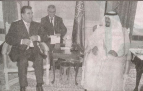
سمو ولي العهد يستقبل رئيس وزراء طاجيكستان

وحضر الاستقبالات صاحب السمو الملكي سعود الفيصل وزير الخارجية وصاحب السمو الملكي الأمير تركي الفيصل سفير خادم الحرمين الشريفين لدى الولايات المتحدة الأمريكية وصاحب السمو الأمير تركي بن محمد بن سعود الكبير وكيل وزارة الخارجية المساعد للشؤون السياسية رئيس الادارة العامة للمنظمات الدولية وصاحب السمو الأمير فيصل بن سعود بن محمد وصاحب السمو الملكي الأمير مشعل بن عبدالله بن عبدالعزيز الوزير المفوض بوزارة الخارجية وصاحب السمو الملكي الأمير سليمان بن سلطان بن عبدالعزيز الوزير المفوض بسفارة خادم الحرمين الشريفين في واشنطن ومعالي وزير الدولة عضو مجلس الوزراء الدكتور مساعد بن محمد العيبان ومعالي وزير المالية وزير الاقتصاد والتخطيط الأستاذ خالد القصيبي.