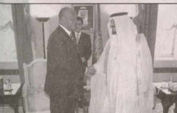
سمو ولي العهد يستقبل رئيس وزراء غينيا