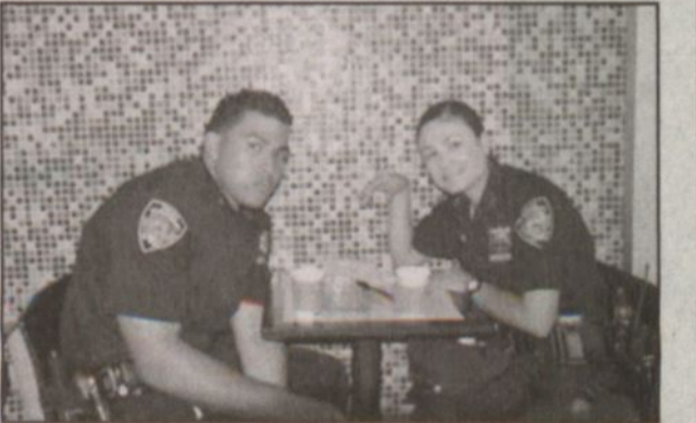
اثنان من مسؤولي الأمن خلال استراحة قصيرة بعد عمل ميداني مشق