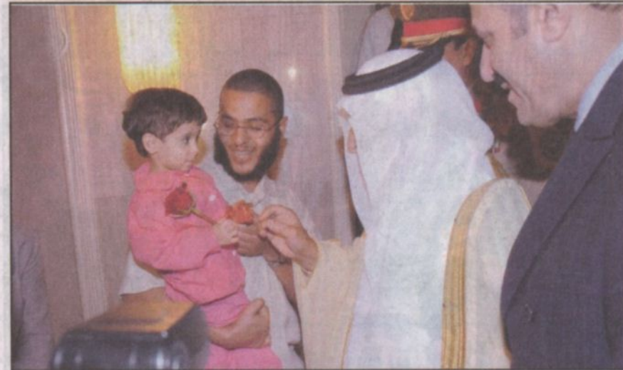
سموه يدايع أحد الأطفال خلال اللقاء