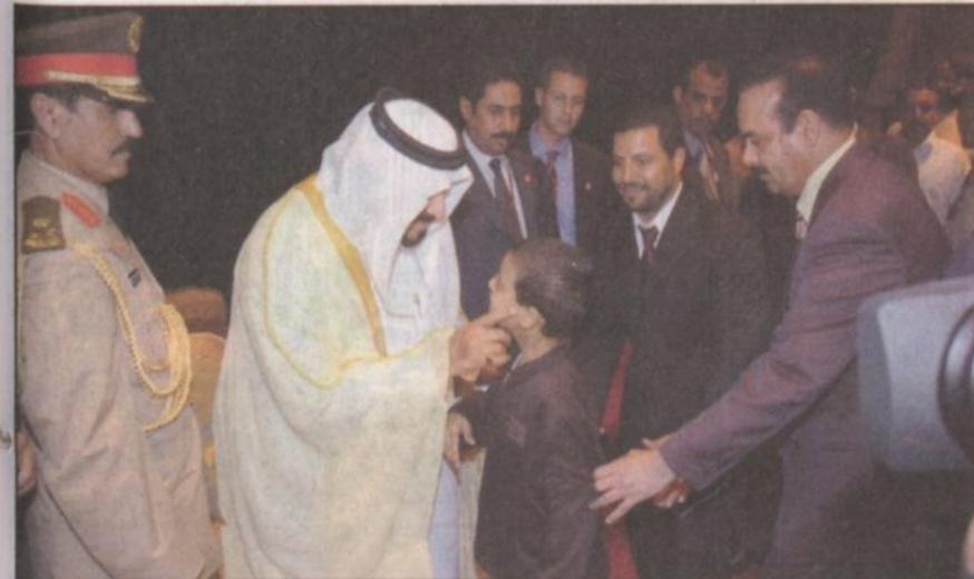
أحد أبناء الطلاب السعوديين يتشرف بالسلام على سمو ولي العهد