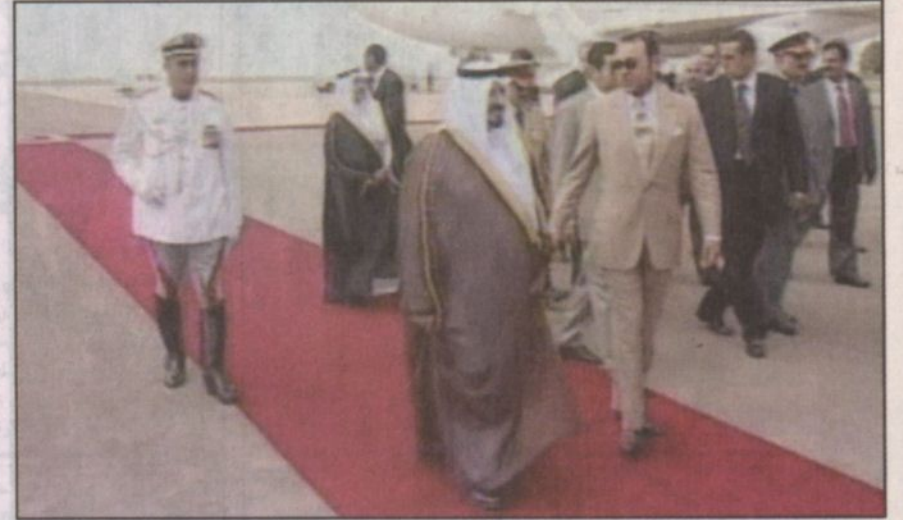
العاقل المغربي في استقبال سمو ولي العهد لدى وصوله إلى الدار البيضاء