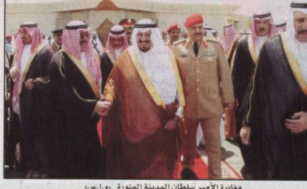
مغادرة الأمير سلطان المدينة المنورة - و.أ.س.

صاحب السمو الملكي الأمير منصور بن مقرن بن عبدالعزيز ومعالى وزير الثقافة والأعلام الأستاذ ابدان بن أمين مدني ومعالى أمين منطقة المدينة المنورة المهندس عبدالعزيز الحصين وكبار المسؤولين من مدينتي وعسكريين. حفظ الله سمو ولي العهد في سفره وإقامته.