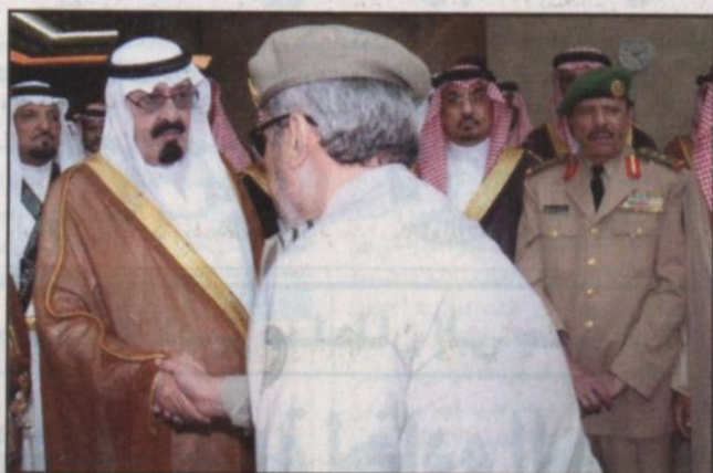
مغادرة خادم الحرمين الشريفين المدينة المنورة - و.أ.س.