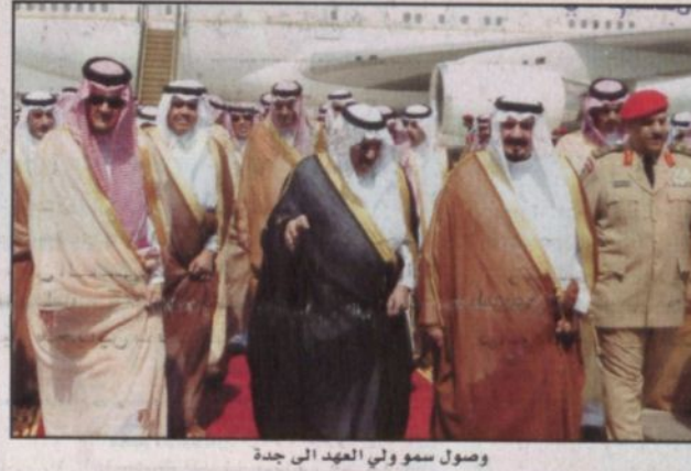
وصول سمو ولي العهد إلى جدة