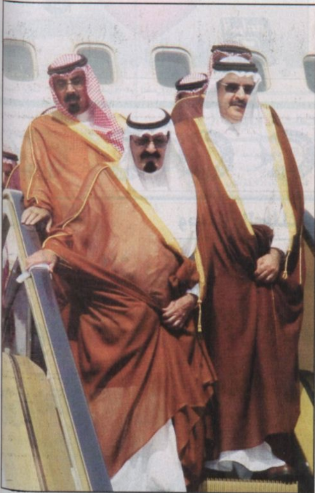
خادم الحرمين لدى وصوله إلى جدة