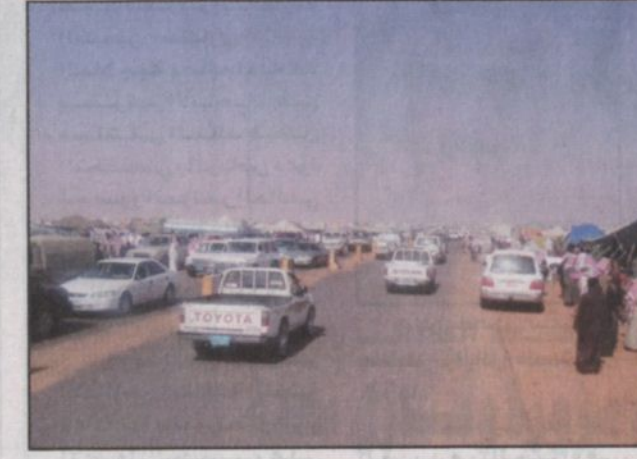
سوق شعبي على هامش الحفل