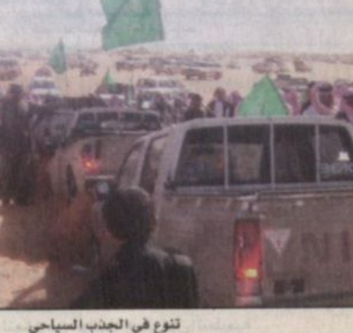
تتوزع في الحديب السياحي