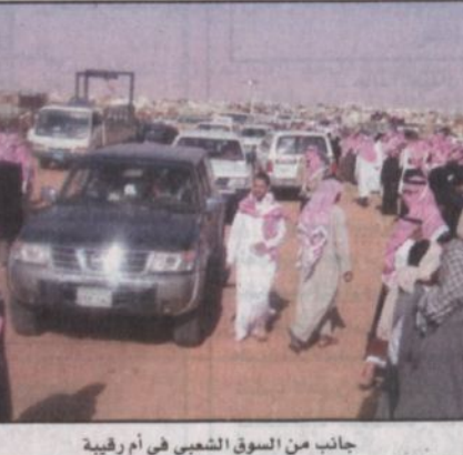
جانب من السوق الشعبي في أم رقيبة