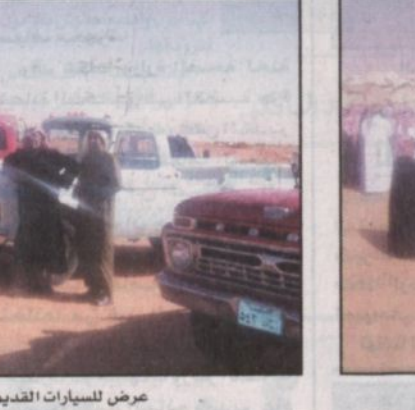
حراج الإبل في السوق الشعبي