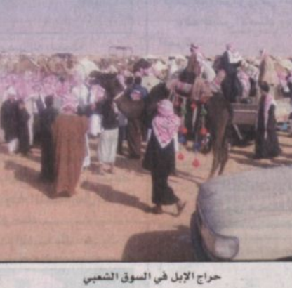
جانب من السوق الشعبي في أم رقيبة

انتقلت الرياض، إلى أم رقيبة حيث ساحة المسابقة وصدت كل مظاهر هذا المهرجان الكبير والحضور الجماهيري غير المسبوق والذي قدر حضوره في يوم الخميس بما يقارب الملة والخمسين ألف متفرج بالنسبة لعموم الحضور الذين تواجدوا في السوق الشعبي وفي ساحة المخيمات وكانت قد التقت رئيس اللجنة المنظمة ورئيس لجنة التحكيم الأمير عبدالله بن سعد بن جلوي والذي قال لـ الرياض، ان الجائزة كما هو معروف ستكون هذا العام الأولى للنخبة على جائزة الملك عبدالعزيز وخاصة لملك الإبل في دول مجلس التعاون الخليجي والثانية لمزايين الإبل على جائزة خادم الحرمين الشريفين والثالثة للشحول وستكون لأطيب فحل من جميع الألوائل - واحد لكل لون ومعه اربعة الى خمسة من نسله (حفات) أو (مغاريل) بالإضافة إلى جائزة الفردي لأفضل وضاحوين - أي اثنتان من الوضع (وشعلى) و احدة مشيراً إلى ان فئة الحمر التي لم تشارك في الأعوام الماضية دخلت المنافسة لأول مرة هذا العام إلى جانب الفئات الرئيسية المعروفة الشعل - والصفير - والمجاهيم - والمغتابر.