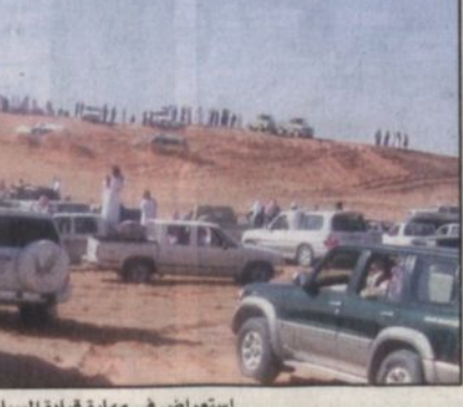
استعراض في مهارة قيادة السيارة