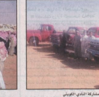
عرض للسيارات القديمة بمشاركة النادي الكويتي