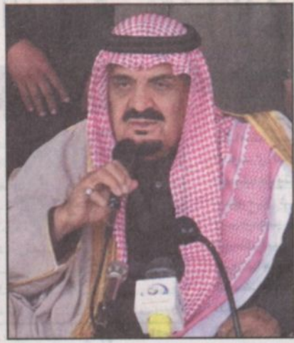
الأمير مشعل بن عبدالعزيز

هذا العام لأول مرة ولا شك أن دخول هذه الفئة إلى حيز المنافسة وانضمامها إلى الفئات الأخرى سيفضي على الجائزة مزيداً من النجاح وحول سؤال عن لجنة التحكيم المكونة من عشرة حكام من أهل الخبرة والدراية بالإضافة على رئيس اللجنة قال الأمير عبدالله بأن الأمير مشعل رأى أن تكون ممثلة من جميع القبائل ودخول حكم واحد من دول مجلس التعاون الخليجي ضمن لجنة التحكيم وتم ترشيحهم من شيخ قبائلهم ممن تتوزع فيه الدراية والأمانة والدين ادا قسم المسابقة قبل ان يباشرو مهام عملهم وحول سؤال الأمير مشعل عن نص القسم الذي يحلف به الحكم وكذلك القسم الذي يحلف به المالك قال يحلف الحكم بقوله باسم بالله العظيم اني لا اخاشي في دمستي لأحد عن أحد، ويحلف صاحب الإبل المشاركة أنها مكتملة الشروط التي حددتها المسابقة.