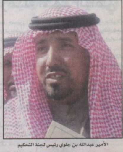
الأمير عبدالله بن جلوي رئيس لجنة التحكيم

يرعى صاحب السمو الملكي الأمير مشعل بن عبدالعزيز آل سعود بعد ظهر هذا اليوم الجمعة الحفل الختامي السادس لتوزيع جوائز مهرجان مزايين الإبل لمسابقة جائزة الملك عبدالعزيز يرجمه الله وجائزة خادم الحرمين الشريفين الملك عبدالله بن عبدالعزيز يحفظه الله وذلك في ساحة العرض المخصصة في أم رقيبة بمحافظة حفر الباطن وذلك بحضور عدد من أصحاب السمو الملكي الأمراء والمعالى الوزراء والمهتمين برياسة الإبل من داخل المملكة ومن دول مجلس التعاون الخليجي والتي يشترك بها عدد كبير من الإبل من مختلف أنحاء المملكة ودول مجلس التعاون الخليجي وتأتي هذه المسابقة السنوية للمحافظة على تراث الأبناء والأجداد وكذلك المحافظة على تاسل تلك الإبل وتمتعها والذي يعكس على الناحية الاقتصادية فوائد عديدة ولما للإبل من تاريخ مشرق في الزمن السابق حيث هي