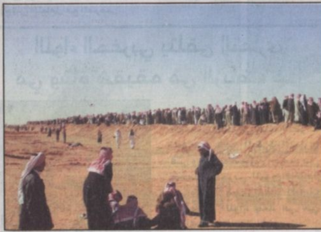
جمهور كبير تابع المسابقة