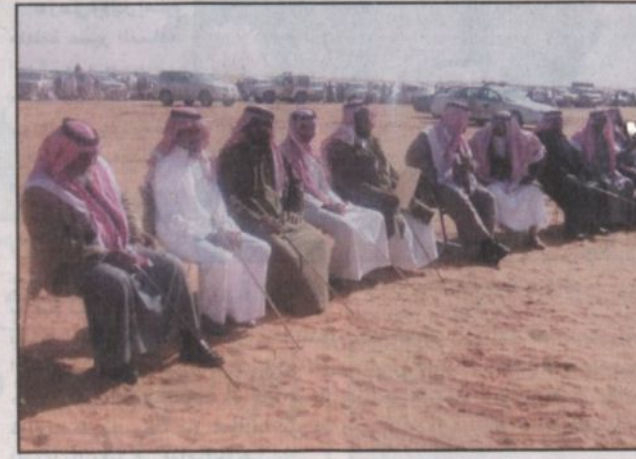
لجنة التحكيم في ساحة العرض خلال فترة التقييم