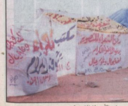
مخيم الأمسيات الشعرية

وعن لجنة التحكيم البالغ عددها أحد عشر حكماً بما فيهم رئيس اللجنة قال بأنه قد جرى تغيير جندي في اللجنة وفي عملية الاختيار هذا العام تشمل جميع القبائل بالإضافة إلى حكم من إحدى دول مجلس التعاون الذين تم اختيارهم بالتسويق مع شيخ قبائلهم على أساس خبرتهم ومقدرتهم والشهادة لهم بالثقة والأمانة التي هي أحد أساسيات نجاح هذا المهرجان في عملية الاختيار وقد أود جمعاً قسم التحكيم الذي سألت الرياض، عن نصه فقال، يحلف الحكم بقوله، أقسم بالله العظيم أنني لا أخاشي في دمتي لأحد من أحد - ويحلف صاحب الإبل المشاركة أنها مكتملة الشروط التي حددتها المسابقة.