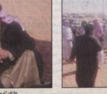
تتوزع في الحديب السياحي