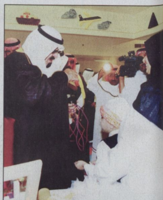
خادم الحرمين الشريفين يلمن على صحة أحد الأطفال