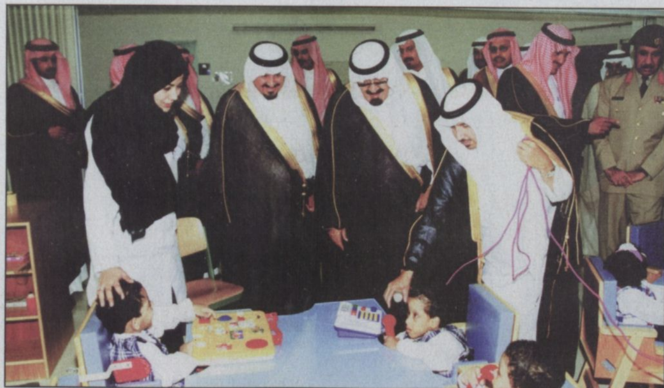
الملك عبدالله بنوالمعوقين عناية ورعاية خاصة