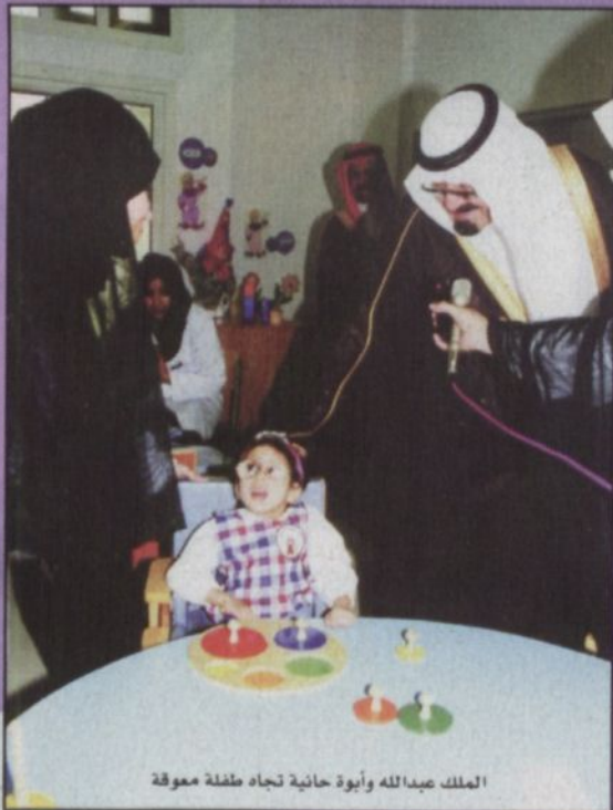
الملك عبدالله وأبوة حانية تجاه طفلة معوقة