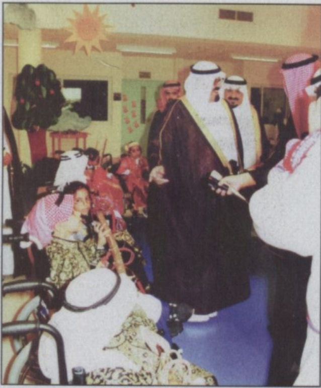
إتسامة أوروبية من ملكة الإنسانية