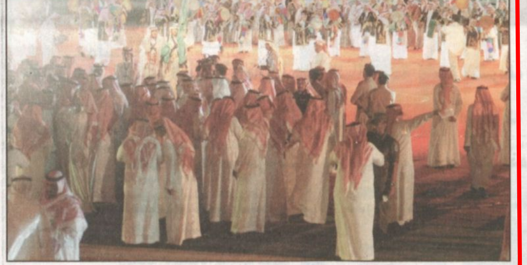
وبروفات للعرضة التي ستقدمها فرقة الدرعية