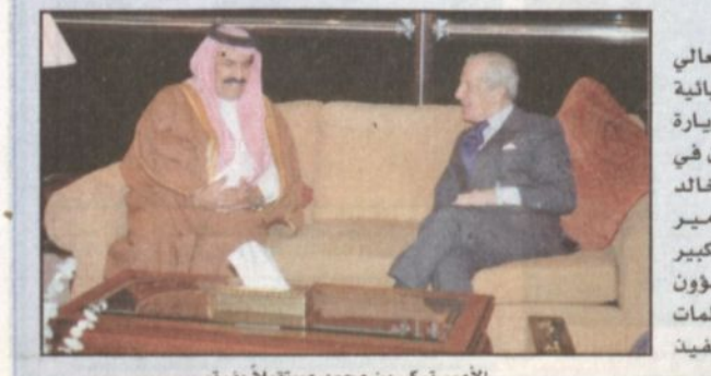
الأمير تركي بن محمد مستقبلاً بفرز

الرياض (و.أ.س.)، وصل إلى الرياض مساء أمس معالي السفير خوليو برترتير في زيارة للمملكة تستغرق ثلاثة أيام. وكان في استقباله لدى وصوله مطار الملك خالد الدولي صاحب السمو الملكي الأمير الدكتور تركي بن محمد بن سعود الكبير وكيل وزارة الخارجية المساعد للشؤون السياسية ورئيس الإدارة العامة للمنظمات الدولية ورئيس الهيئة الوطنية لتنفيذ اتفاقية الأسلحة الكيميائية.