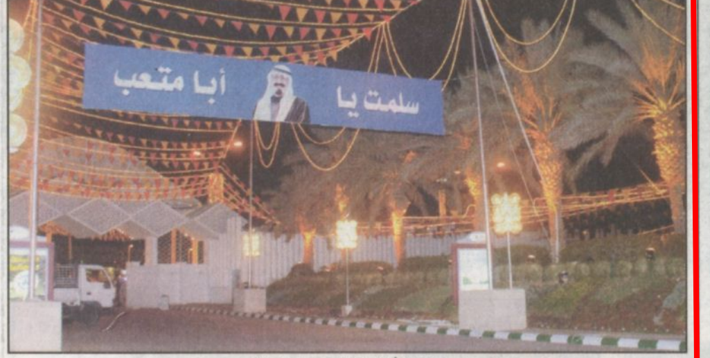
مداخل الأستاذ وقد ازدادت بمقدم العليق