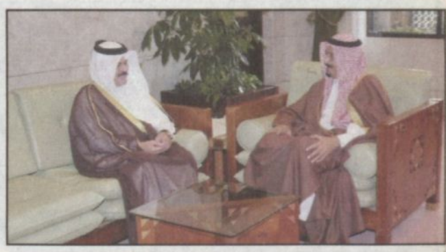
الأمير سلمان يستقبل الأمين العام لمجلس التعاون الخليجي (و.أ.س.)