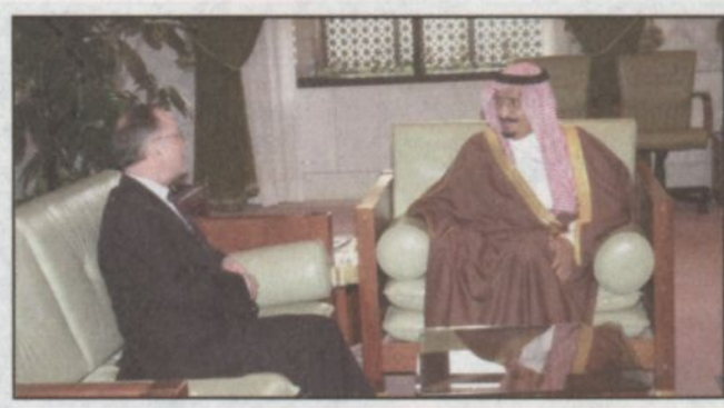
الأمير سلمان يستقبل السفير الفنلندي

حضر الجولة عدد من أصحاب السمو وكبار المسؤولين والمعنيين بالتخطيط والاحتفاء من كافة القطاعات الحكومية والأمنية.