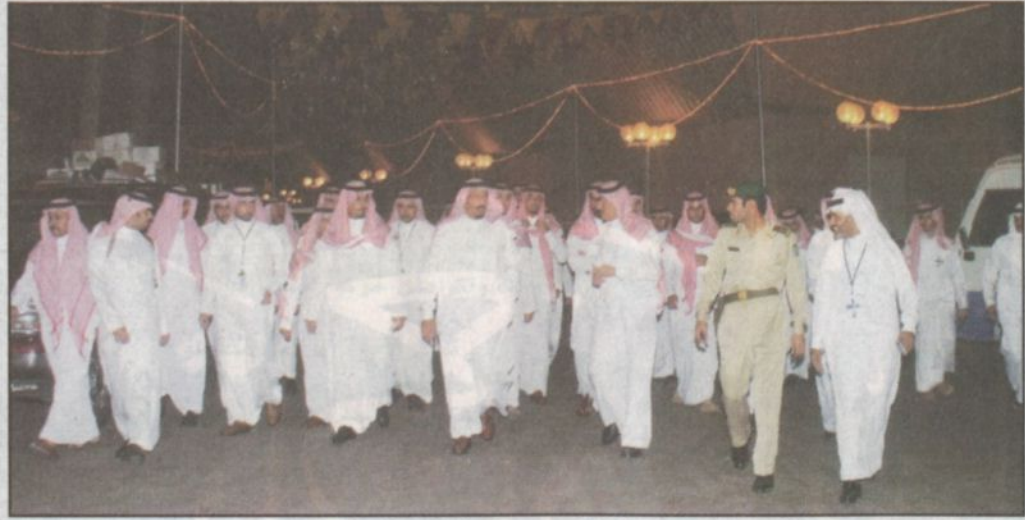
الأمير سلمان خلال الجولة برفاقه عدد من أصحاب السمو والمسؤولين داخل الاستاد