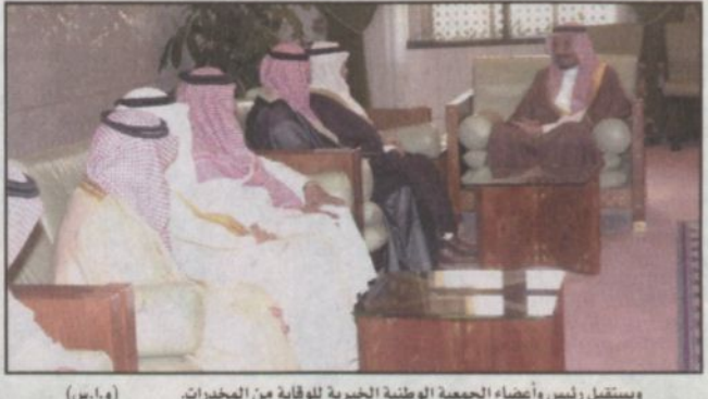
ويستقبل رئيس وأعضاء الجمعية الوطنية الخيرية للوقاية من المخدرات (و.أ.س.)

السوم المضرة. ونوه سمو أمير منطقة الرياض بالجهود التي قامت بها الجمعية في توعية المجتمع بالأضرار الناجمة عن الادمان ومساوئه وكيفية التخلص منه ومكافحته ودعوة شرائح المجتمع لمحاربة المخدرات والتخلص منها. كما استقبل صاحب السمو الملكي الأمير سلمان بن عبدالعزيز أمير منطقة الرياض في مكتب سموه بقصر الحكم اليوم معالي الأمين العام لمجلس التعاون لدول الخليج العربية عبدالرحمن بن حمد العطية. وركز الحديث خلال الاستقبال على الموضوعات التي تهم دول مجلس التعاون في مختلف المجالات.