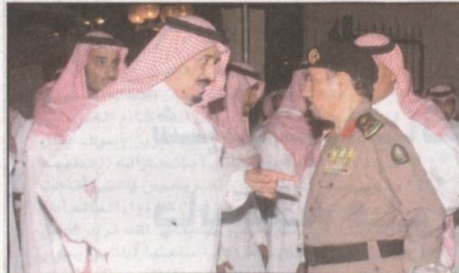
اللواء الشهواني يستمع إلى توجيهات الأمير سلمان

متابعة - مناحي الشيباني، نفذت شرطة منطقة الرياض مساء أمس في الموقع المعد لاحتفالات أهالي الرياض بمناسبة تولي خادم الحرمين الشريفين الملك عبدالله بن عبدالعزيز آل سعود مقاليد الحكم باستاد الأمير فيصل بن فهد بالملز بروفة لخطة الأمن في حضور صاحب السمو الملكي الأمير سلمان بن عبدالعزيز آل سعود أمير منطقة الرياض. وقامت الفرق الأمنية بشرطة منطقة الرياض التي ستشارك في تنظيم هذه الاحتفالية مساء أمس الاثنين بتنفيذ بروفة لخطة الأمن في استاد الأمير فيصل بن فهد لمرحلة مدي جاهزية رجال الأمن لهذه المناسبة والتي تعبر بصدق عن المشاعر الفياضة لأهالي الرياض تجاه خادم الحرمين الشريفين الملك عبدالله بن عبدالعزيز آل سعود وشارك في هذه البروفة أكثر من (٥٠٠) فرقة أمنية من دوريات الأمن وأكثر من (٧٠٠) فرداً وضابطاً بواسطة عدد كبير من الأليات التابعة للقطاعات الأمنية كما شاركت عدد من القوات الأمنية التي تشارك في تغطية الحفل في هذه البروفة ومنها فرق من قوة المهمات والواجبات الخاصة وشعبة التحريات والبحث الجنائي بشرطة منطقة الرياض والدفاع المدني