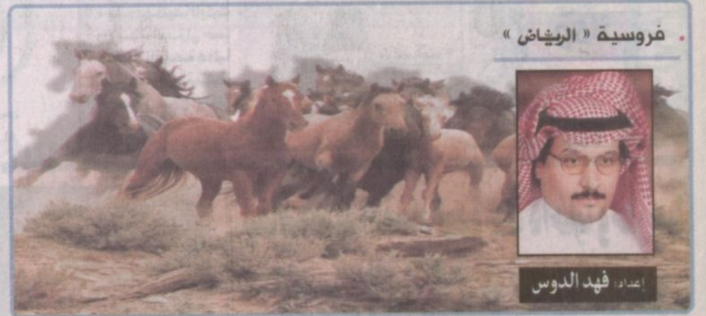
اعداد: فيهد الدوس