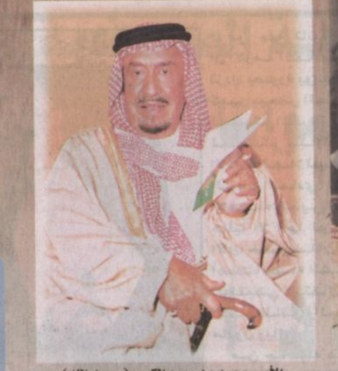
الأمير محمد بن سعود الكبير (رحمه الله)

نيابة عن الملك عبدالله.. الأمير بدر يعرئ اليوم عرس الفروسية على كأس الأمير محمد بن سعود الكبير