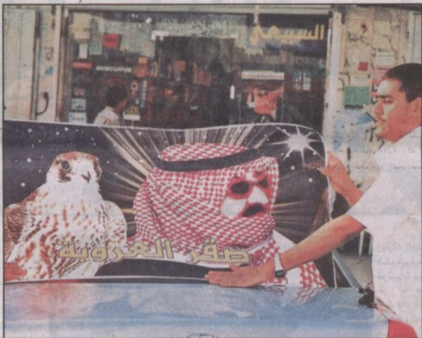
شاب يقوم بتعليق صورة خادم الحرمين على سيارته