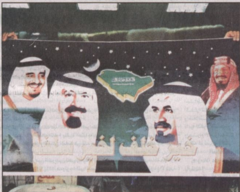
خير خلف لخبر سلف شعار يحمل صورة المؤسس والملك فهد والملك عبدالله وولي العهد الأمير سلطان

ويضيف الشيخ الحقباني: بايعنا الملك فيصل رحمه الله ثم حضرت مبايعة الملك خالد رحمه الله وأقام أهالي منطقة الرياض حفلاً للملك فهد بن عبدالعزيز يرحمه الله في استاد الأمير فيصل بن فهد بن عبدالعزيز بالمزل وكنت مسؤولاً عن جمع تبرعات الأهالي بتوجيهات من صاحب السمو الملكي الأمير سلمان بن عبدالعزيز أمير منطقة الرياض حيث أهدى أهالي منطقة الرياض للملك فهد هدية تتمثل في بناء مكتبة الملك فهد الوطنية.