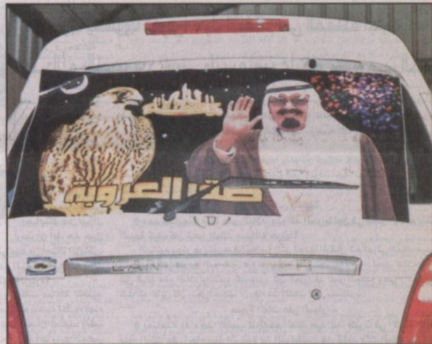
أحد الشعارات التي تحمل صور خادم الحرمين الشريفين