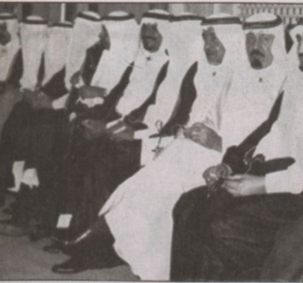
الملك عبدالله مع الملك فهد رحمه الله ويظهر الزعيم الفلسطيني الراحل ياسر عرفات