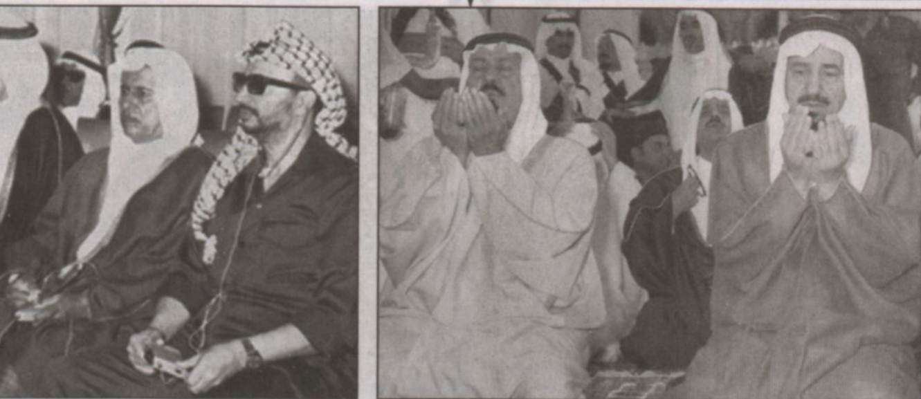
الملك عبدالله كان قريباً من جميع إخوته الملوك ويظهر في الصورة إلى جانب الملك خالد رحمه الله