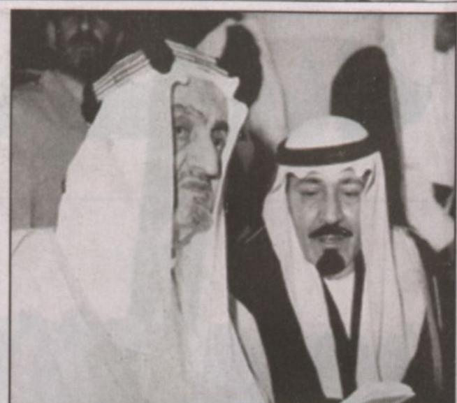
خادم الحرمين إلى جوار الملك فيصل رحمه الله