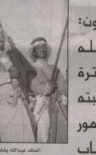
الملك عبدالله يشارك في العرضة السعودية في منامة أخرى