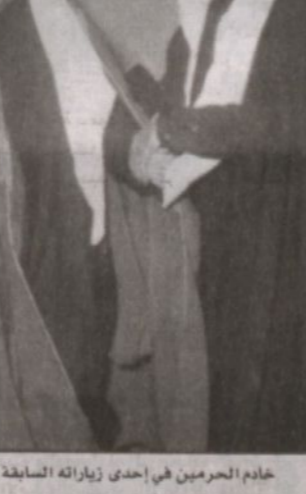
خادم الحرمين في إحدى زيارته السابقة للكويت

المواصلة العمل بنهج المؤسسة ترسيخ للاستقرار السياسي والاقامة تصدي في المنطقة