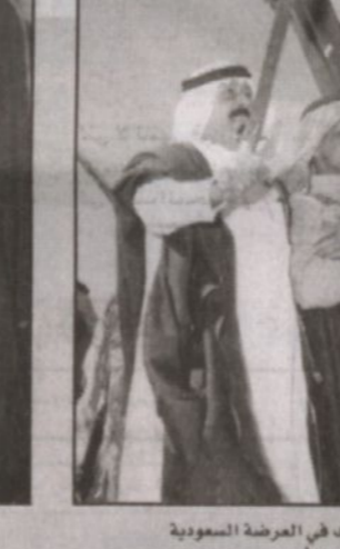
الملك عبدالله يشارك في العرضة السعودية في منامة أخرى