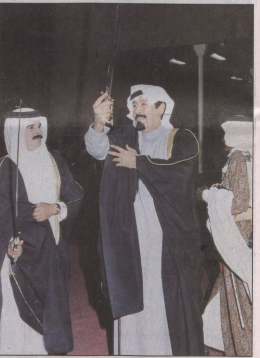
الملك عبدالله وملك البحرين يبدوان العرضة السعودية بالبحرين