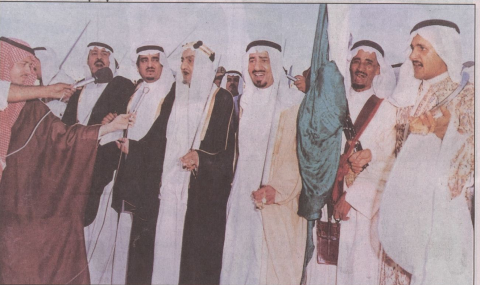
الملك فيصل والملك خالد والملك فهد - رحمهم الله - والملك عبدالعزيز يبدون العرضة السعودية في إحدى المناسبات الوطنية

شارك في العرضة السعودية لأول مرة في عهد الملك المؤسس