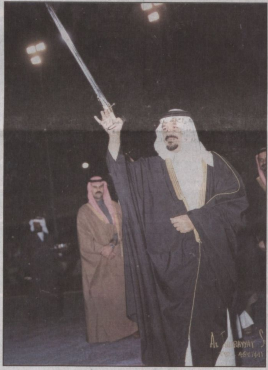
سمو ولي العهد الأمير سلطان يؤدي العرضة السعودية