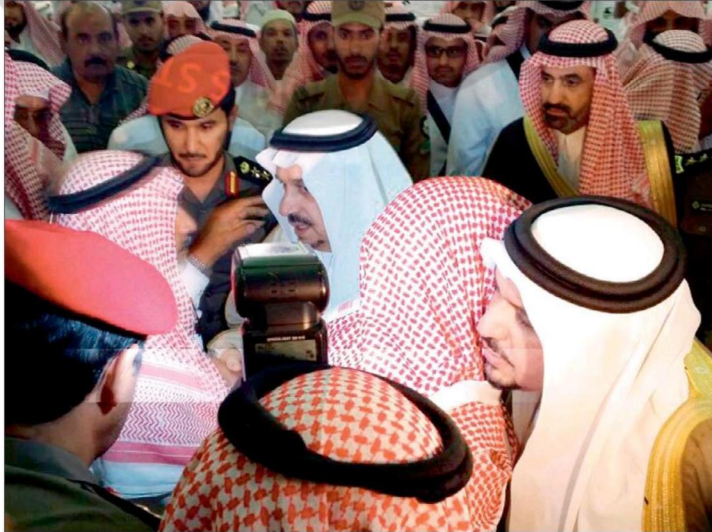
الأمير فيصل بن بندر معزيا ذوي الشهيد العنزي.

تشجيع جثمان الشهيد العنزي.. وأمير القصيم ناقلا تعازي القيادة لذويه: //