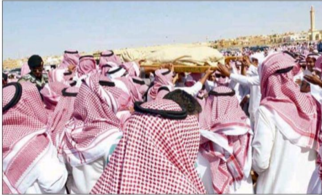
جثمان الشهيد محمولا على الأعناق.

التاريخ: 2014-11-06 رقم العدد: 17603 رقم الصفحة: 7 مسلسل: 47 رقم القصاصة: 2