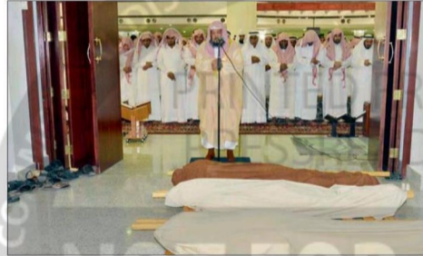
الصلاة على الشهيد مع متوفين آخرين في جامع الإمام محمد بن عبد الوهاب بمدينة بريدة.