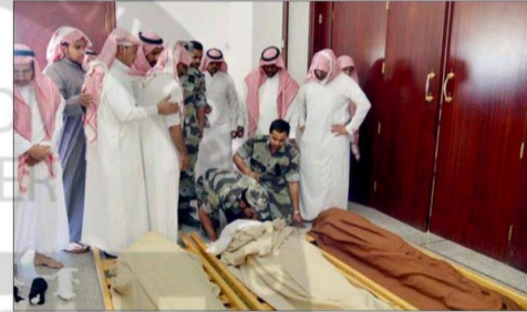
أقارب وزملاء العنزي يلقون النظرة الأخيرة عليه قبل الصلاة عليه.