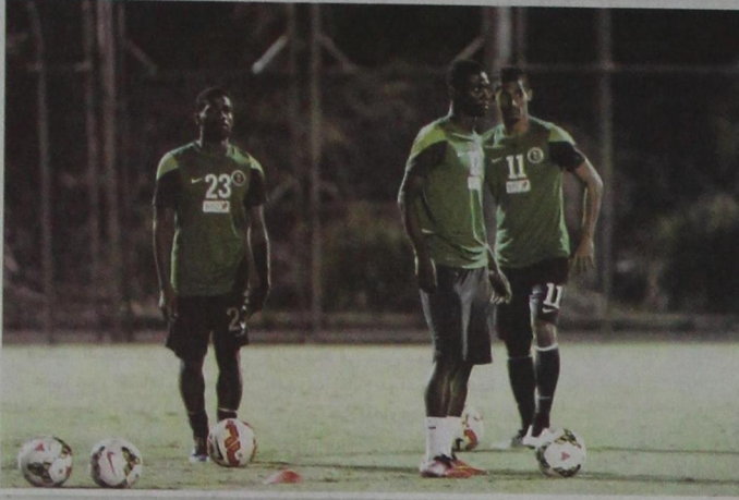
اللاعبون أبوا جاهزية كبيرة

عيد: حزين لضعف الإعلام السعودي في البطولة ومقصرون في عدم نقل لقاء كوريا الجنوبية المنتخب تعدل كثيراً مع كوزمين وهدفنا اللقب الآسيوي