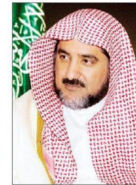
د. صالح آل الشيخ