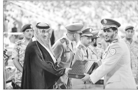
سموه يكرم قادة السرايا

سموه يتسلم خريجي البرية شهادات تخرجهم تكون يد سموكم الحانية هي من تمنحنا الإذن للانطلاق في ميادين العزة والشرف. صاحب السمو: إن الكلمات تعجز عن شكر سموكم الكريم وأنتم تضيفون لنا