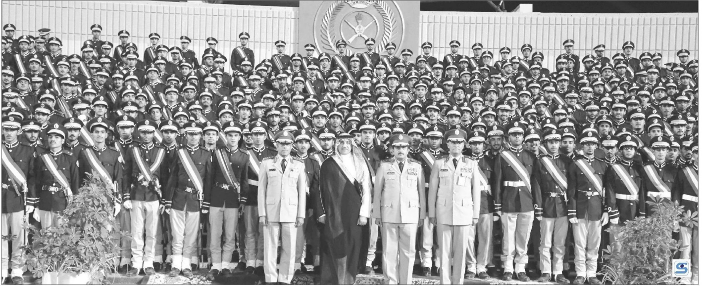
صورة تذكارية لخريجي الكلية الحربية مع سموه