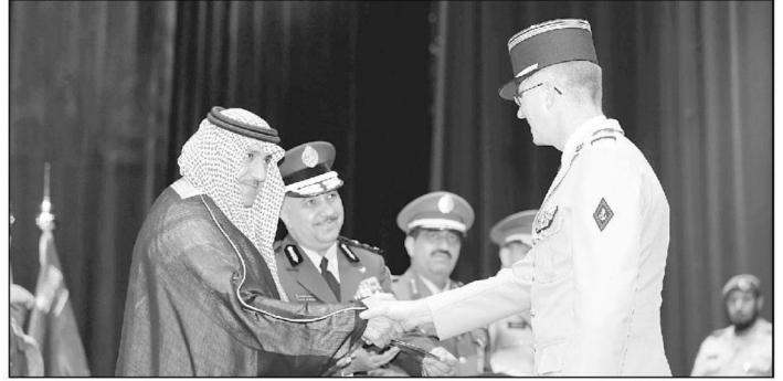
فائد عسكري فرنسي يتسلم شهادة تخرجه