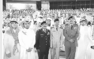
والجزيرة ترصد فرحة أهالي الخريجين