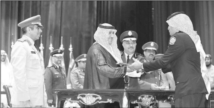
خريج من الحرس الوطني