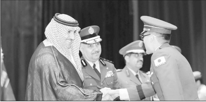
فائد عسكري كويتي... وفرحة التخرج

نيابة عن ولي العهد وزير الدفاع صاحب السمو الملكي الأمير سلمان بن عبد العزيز، رعى صاحب السمو الملكي الأمير تركي بن عبد الله أمير منطقة الرياض حفل كلية القيادة والأركان، حيث كان في استقبال سموه معالي الفريق أول عبد الرحمن بن صالح النيان رئيس هيئة الأركان العامة للقوات المسلحة، وسمو محافظ الدرعية الأمير أحمد بن عبد الرحمن، ومفاند كلية القيادة والأركان اللواء طيار علي بن محمد بن حزام الشهري، وقد عزّفت السلام الملكي، ثم تشرف بالسلام على سموه قادة القطاعات العسكرية بوزارة الدفاع ومنسوبي الكلية، حيث أخذ سموه مكانه في الحفل، ثم بدأ الحفل بالقرآن الكريم.