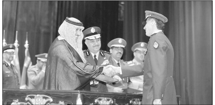
فائد عسكري لبناني

وما تتمتع به المملكة من أمن واستقرار وبالمؤسسات والنقاشات التي طرحت في هذه الدورات والزيارات الميدانية لبعض القطاعات العسكرية، وأن هذا مثل التعاون بين الدول هو جسور للتواصل. الجدير ذكره أن هناك حوالي 22 ضابطاً من 15 دولة مختلفة تم تخرجهم من هذه الدورات.