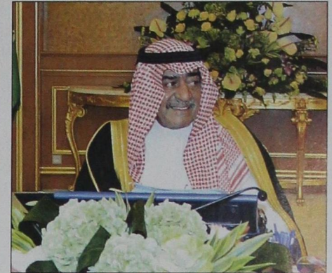
ولي ولي العهد خلال ترؤسه المجلس أمس