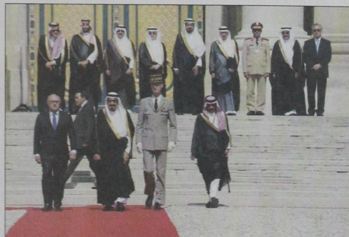
جانب من وصول الأمير سلمان إلى باريس