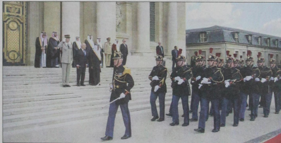
حرس الشرف الفرنسي يؤدي استعراضاً أمام ولي العهد