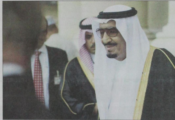
وصول الأمير سلمان إلى باريس