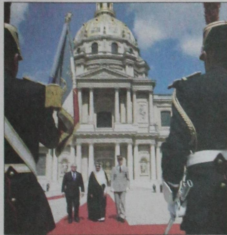
استقبال رسمي لسمو ولي العهد (و.أ.س)