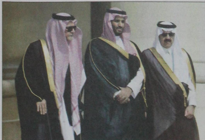
الأمير سعود الفيصل والأمير محمد بن سلمان ومساعد العياني خلال الاستقبال