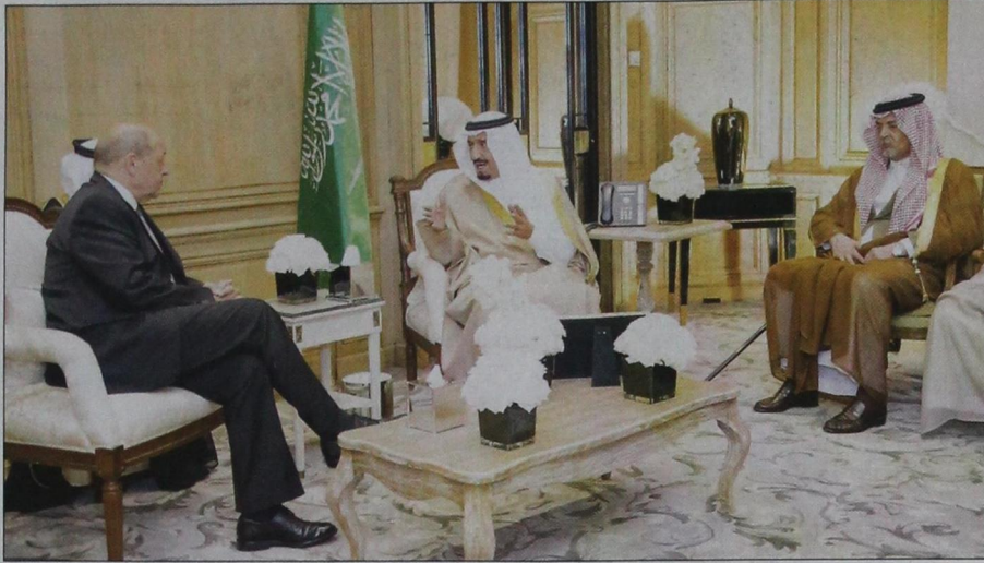
جانب من اجتماع ولي العهد بوزير الدفاع الفرنسي

سموه يعبر عن سعادته بالزيارة وما عقده من لقاءات بالقيادة الفرنسية تهم مصلحة البلدين