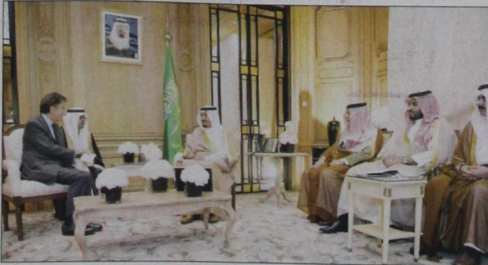
جانب من لقاء الأمير سلمان مع جاك لانق (و.ا.س)

واجتمع صاحب السمو الملكي الأمير سلمان بن عبدالعزيز آل سعود ولي العهد نائب رئيس مجلس الوزراء وزير الدفاع في باريس امس مع معالي وزير الدفاع الفرنسي جان إيف لو دريا. وجرى خلال الاجتماع التأكيد على تميز العلاقات الثنائية بين المملكة وفرنسا