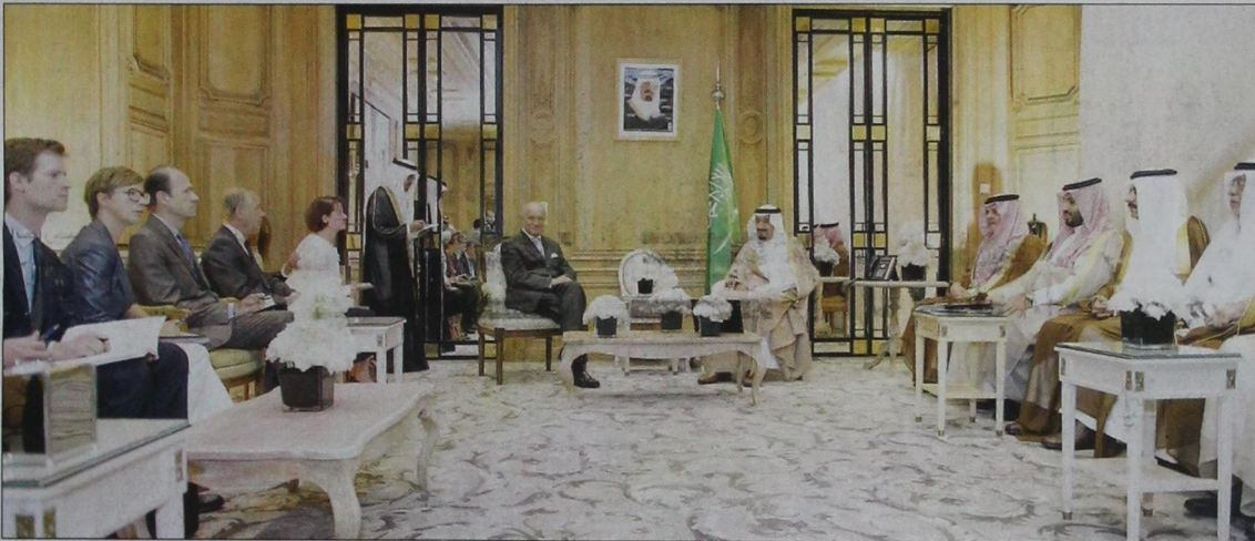
جانب من لقاء سمو ولي العهد مع وزير الخارجية الفرنسي

أمير سلمان التقى رئيس معهد العالم العربي ونوه بدور المعهد في تعزيز التواصل والتعاون بين الثقافتين العربية والفرنسية