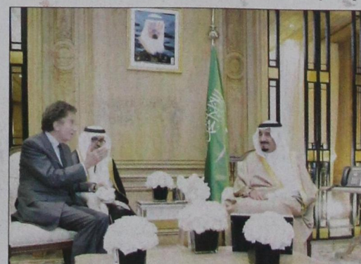
ولي العهد خلال لقائه رئيس معهد العالم العربي في باريس