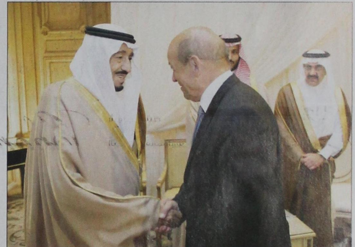
وزير الدفاع الفرنسي مرحباً بولي العهد (و.ا.س)

جاك لانق يؤكد الاهتمام بتوثيق العلاقات الثقافية مع المملكة لما تتميز به من تاريخ وثقافة عريقة