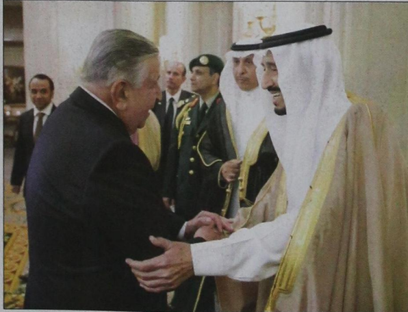
ولي العهد يصافح كبار المسؤولين في الحكومة الفرنسية وأعضاء السلك الدبلوماسي العربي والإسلامي والأجنبي خلال حفل سفارة المملكة في باريس (واس)

كما حضر المآدبة معالي وزير الخارجية الفرنسي لوران فابيوس ومعالي وزير الدفاع جان إيف لو دريا ورئيس معهد العالم العربي جاك لانق ووزيرة الدفاع السابقة ميشيل الو ساري ومستشار الرئيس الفرنسي لشؤون الشرق الأوسط وممثلة المنظمات الدولية في باريس وأعضاء وفد لجنة الصداقة السعودية الفرنسية في مجلس الشورى وعدد من رجال الأعمال السعوديين والفرنسيين أعضاء مجلس الأعمال السعودي الفرنسي.