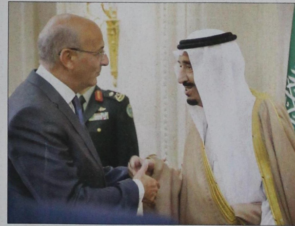
ولي العهد يصافح كبار المسؤولين في الحكومة الفرنسية وأعضاء السلك الدبلوماسي العربي والإسلامي والأجنبي خلال حفل سفارة المملكة في باريس (واس)

وأبرز رئيس معهد العالم العربي خلال اللقاء اهتمام المعهد بتوثيق العلاقات الثقافية