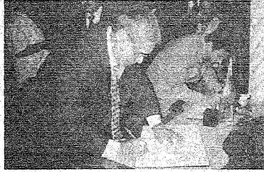
وزير الداخلية اللبناني يخط كلمته

مدير الوكالة الوطنية للإعلام في لبنان اثره قصاص دون في سجل التعازي الكلمة الآتية: "سغياي خادم الحرمين الشريفين الملك فهد بن عبد العزيز، خسر العالم العربي والأسلامي قائداً من خيرة رجاله، ولن ينسى لبنان رعايته