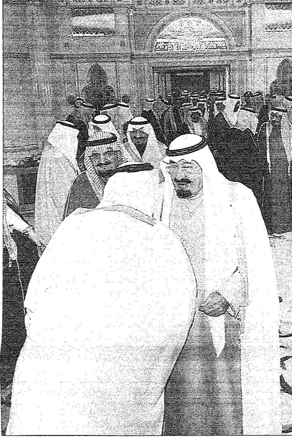
الملك عبدالله يستقبل أبناء وأحفاد المؤسس

التام على أن نرتقي بأي خلاف الى مرتبة الحوار والنقاش بكل شفافية فيما بيننا وأن لا نسمح لأحد بأن يتدخل في أمورنا الخاصة والتي لعلني ثقة ان شاء الله بانتم جميعا تدركون ذلك وتعملون به. خاماً أسأل الله جل جلاله لي ولكم التوفيق والرضى وأن يثبتنا على طاعته «وقل اعملوا فسيبرى الله عملكم ورسوله والمؤمنون». وتذكروا أن لا عزة لكم الا بالدين ولا شرف الا خدمة الوطن ولا عزيمة الا بالصبر والعمل. والسلام عليكم ورحمة الله وبركاته.