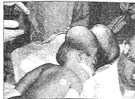
التوأم تحت التخدير