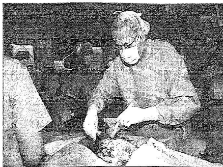
انتهاء عملية لفصل