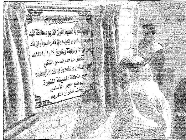
الأمير عبدالعزيز بن ماجد في زيارة سابقة لدى وضع حجر الأساس لجمعية تحفيظ القرآن في المهدي.