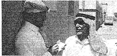
المتقاعد العسوفي : فرحتنا لا توصف

”عدوى“ الفرحة تنتقل من ”أبو سبعة“ لكل الأرجاء