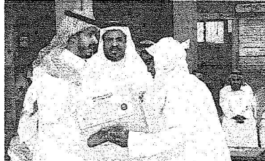
أحد المتقاعدين يتلقى خبر الزيادة