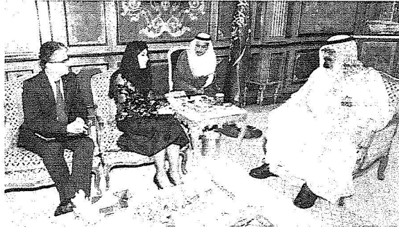
خادم الحرمين مستقبلاً رئيسة البرلمان الألباني والوفد المرافق لها.