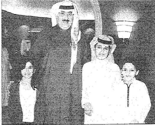
أبو عبدالله محققاً بسعد وأشقائه وبعد نقاش حول رؤيتهم الترشيدية لسباق التيبة

□ نفى الأمير متعب ما تريد في الوسط الفرويسي عن وجود شركة فريسية متخصصة في السياقات ستتسلم النادي في الموسم المقبل.