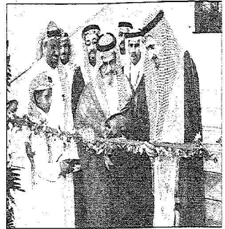
معالي د. العثمان يمشي الحزيب

عمداء كليات طب الأسنان بالجامعات السعودية يعقدون لقاءهم الثاني بجامعة الملك سعود