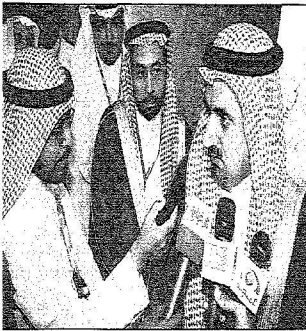
معالي مدير الجامعة يمدد الجزيرة