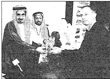
جانب من التكريم