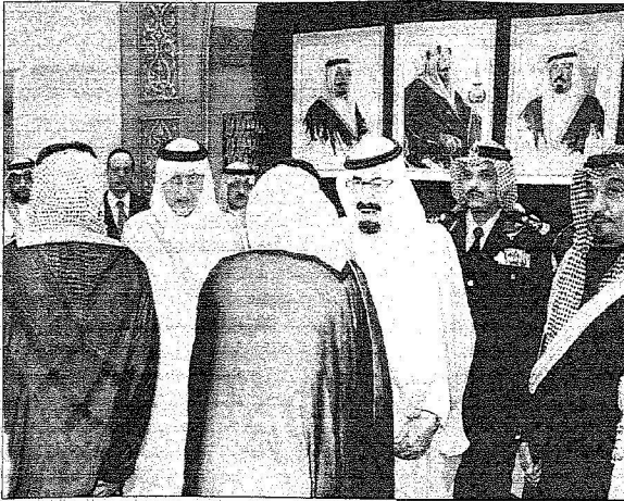
خادم الحرمين يستقبل موديعه لسن في جدة

الإسلام أصل الدين العصرين ومن الآن فالعقل والمنطق بمبدأه