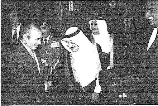
الأمير نايف مصافحاً حبيب العائلي وزير الداخلية المصري

التعاون بين البلدين الشقيقين.. مؤكداً أنها تعد امتداداً حقيقياً للعلاقة الوثيقة الموجودة تحت رعاية خادم الحرمين الشريفين الملك عبدالله بن عبدالعزيز وفخامة الرئيس المصري محمد حسني مبارك.