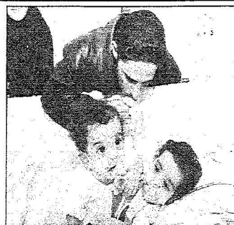
قبلة من والده المقتنين قبل العملية