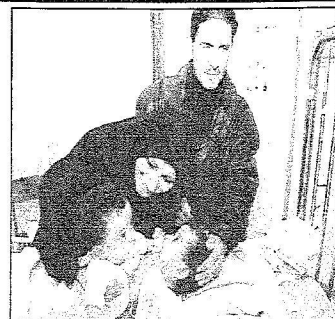
والدة فاطمة والزهاء وشقراء قبل العملية

إنفاذاً لتوجيهات خادم الحرمين تحضيرات عالية الدقة في مدينة الملك عبدالعزيز الطبية بالحرس الوطني