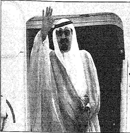
خادم الحرمين يتوجع لوديعه لدى مغادرته مدريد