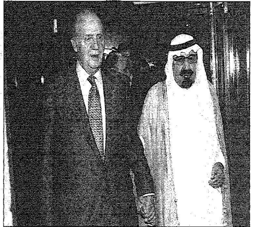
استقبال خادم الحرمين ملك إسبانيا بقلعته بمدريد