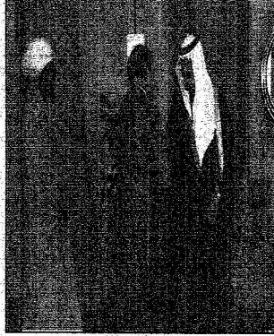
الملك عبدالله يصالغ أحد الوزراء العرب في بداية استقبالهم بهم