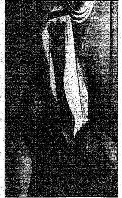
علم الحرمين يتحدث إلى البعثات العربية