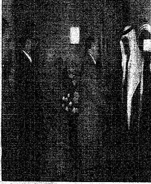
ظفر الحرمين بمرحب بالوفد العربي