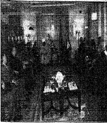
الملك بن عبدالعزيز في استقبال رؤساء البعثات العربية في العاصمة الهندية