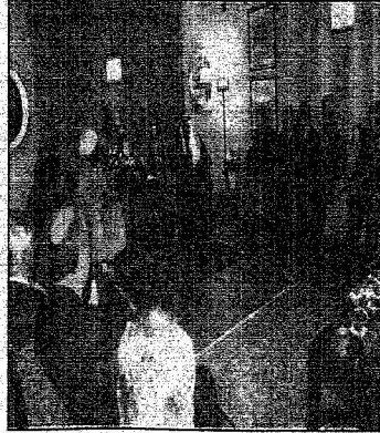
علم الحرمين خلال استقبال البعثات العربية في العاصمة الهندية