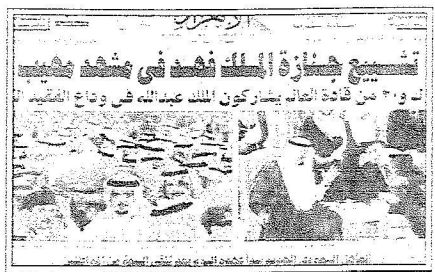
جيزة الملك فهد كانت ماثمة صحيفة الازهر امس

نوهت الصحف المصرية والخالدلة بالانجازات والاربعاء الصبح والحمد لله التي حققها الملك فهد بن عبدالعزيز - رحمه الله - والتي قام بها في سيل نصره القضايا الاسلامية والعربية والدولية موحدة انه لا يمكن تجاوز حقيقة انه دفع بنساء من اجل تطوير وتوسعة واعمار الحرمين الشريفين والمشار المقدسة لتستقبل ملايين الحجاج والمعتمرين والزوار كل عام في يسر وامان وراحه. وقالت ان هذا الراحل الكبير والكريم هو واحد من الرجال الاقادر في المملكة وفي امته العربية والاسلامية وكان له اسماواته المشكورة وتشهد عليها الاعمال وليست الاقوال.