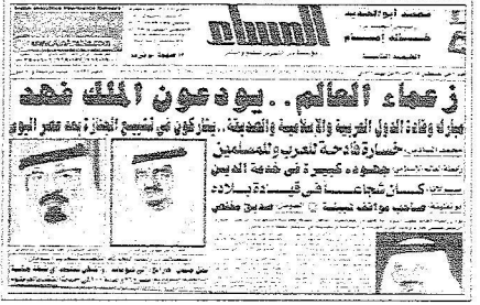
من جوارح الازهر امس

سجدهم التحفيح والتي أوضح فيها ان هذه الاجراءات تجري في مختلف الدول خلال هذه المناسبات، وأشار إلى الأوضاع الامنية في المملكة عادية. شارك في تشييع الجنازة الرئيس صهي مبارك، وعمرو موسى الامين العام للجامعة الدول العربية. وقالت صحيفة (المساء) على صدر صفحتها الاولى: احتشد الآلاف من