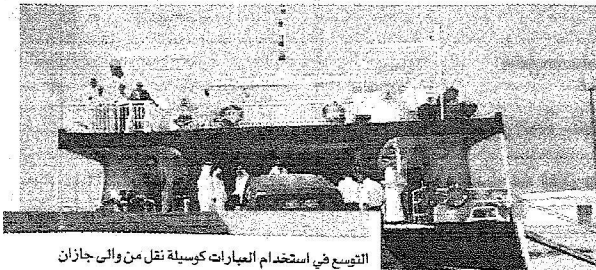
التوسع في استخدام المباريات كوسيلة نقل من وإلى جازان