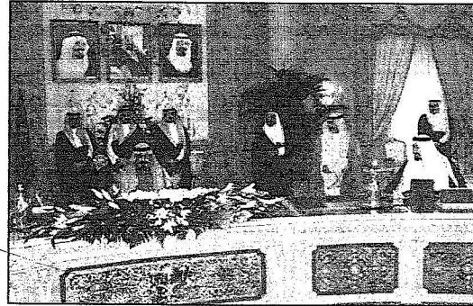
خادم الحرمين متحدثاً بجلسة مجلس الوزراء